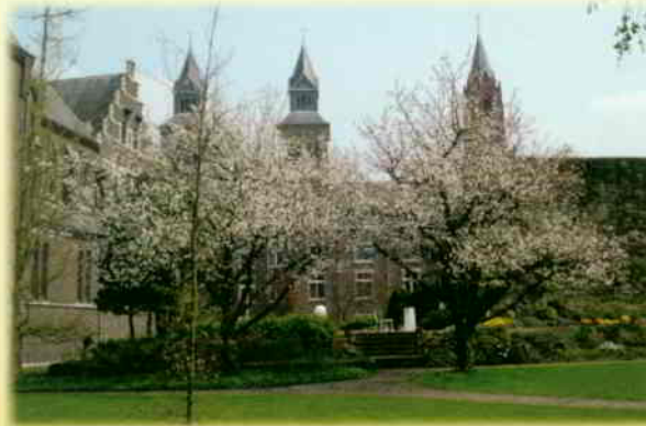
De kloostertuin nodigt uit tot rust en bezinning.

Het Stilte- en Bezinningscentrum ligt als een oase van rust midden in de bedrijvigheid van de stad Maastricht.