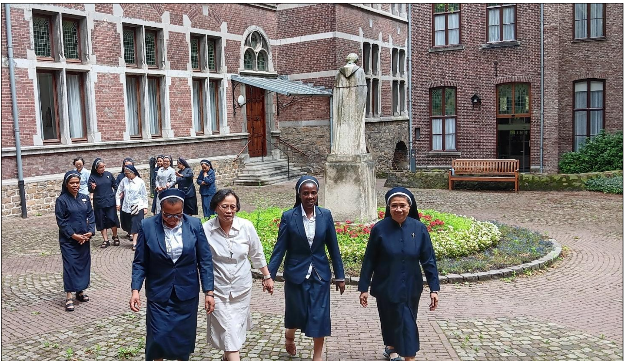
Kedatangan para suster dari Tanzania ke Biara Induk untuk pertama kalinya disambut dengan gembira