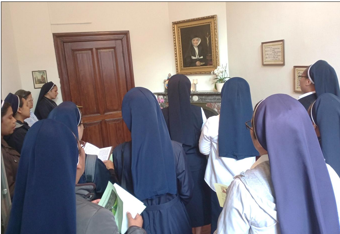
Berdoa bersama di kamar Bunda Elisabeth, Onder de Bogen

Aku bersyukur dan memuji-Mu, Tuhan, atas segala berkat yang telah kuterima. Terima kasih Tuhan karena Engkau telah menyatakan diri-Mu kepadaku, hamba yang lemah ini. Aku siap dan rela untuk selalu bersama-Mu, ya Tuhan. Amin. (*)