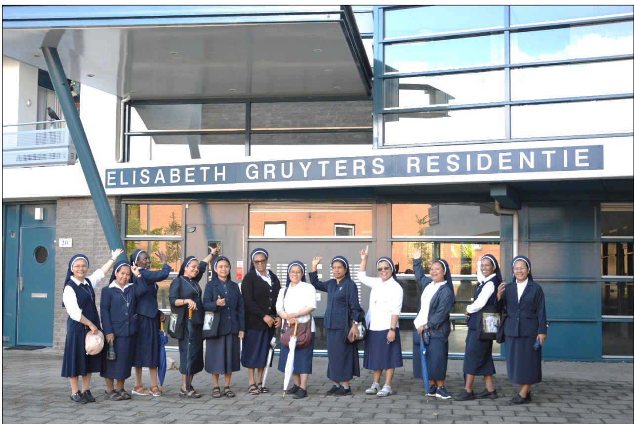
Nama Bunda Elisabeth pun diabadikan sebagai nama residence (tempat tinggal)

Sebagai seorang formator, saya terinspirasi oleh semangat Bunda Elisabeth yang memiliki hati yang peka terhadap kebutuhan zaman dan keteguhan dalam panggilan. Ia tidak menunggu keadaan menjadi ideal untuk bertindak, tetapi menjawab suara Tuhan dengan tindakan konkrit, walau menghadapi banyak tantangan. Hal ini menjadi panggilan bagi saya untuk membentuk calon-calon religius bukan hanya dalam dimensi