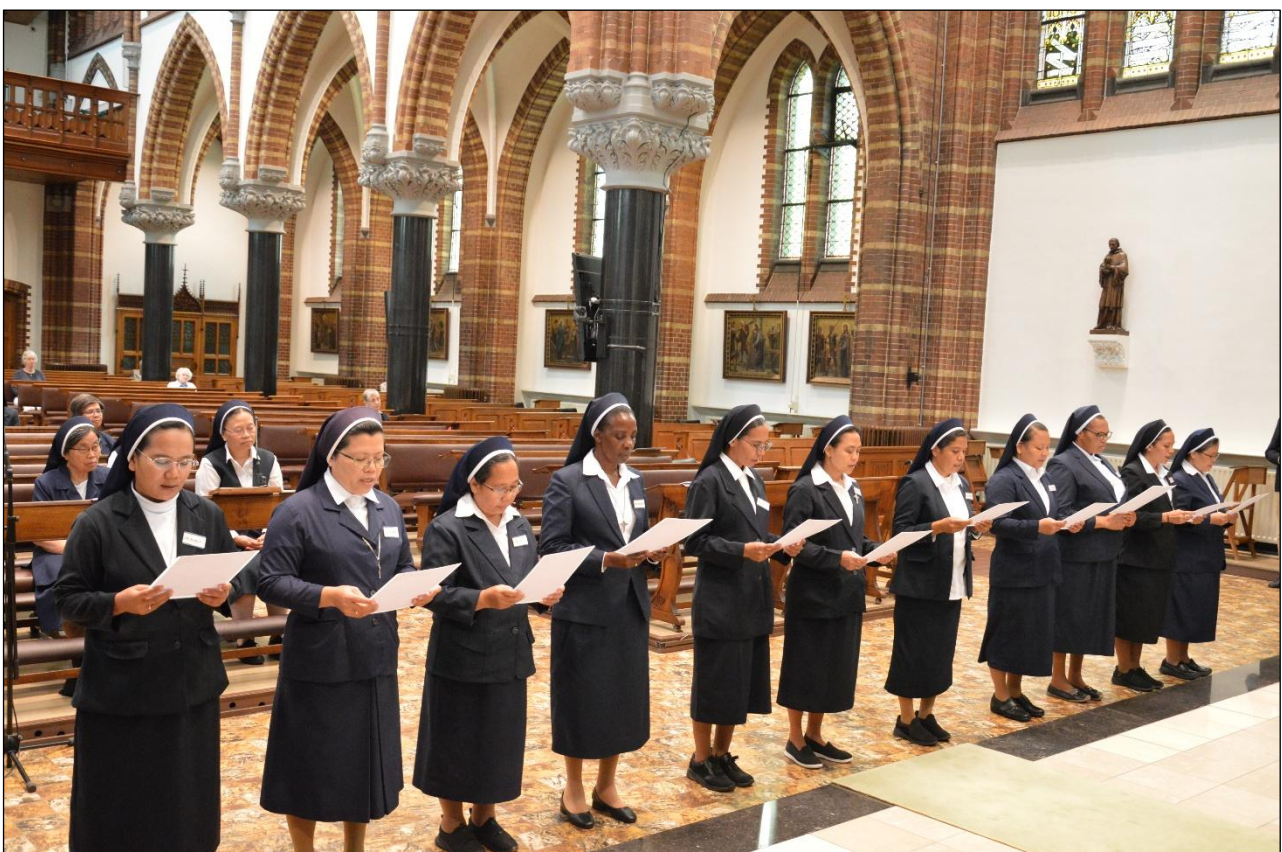
Pembaharuan Kaul Devosional di Kapel Onder de Bogen, Maastricht