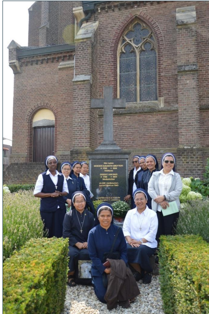
Peserta mengunjungi makam Bunda Elisabeth, Deken Van Baar, dan 224 suster (di samping Gereja St. Petrus & Paulus, Wolder)

Elisabeth, orang-orang sangat bersahaja dan ramah. Lingkungan sekitar yang indah, bersih, dan bebas polusi karena masih banyak pohon yang terawat dengan baik. Banyak keluarga datang ke gereja bersama anak-anak. Saat ini, banyak orangtua yang mengalami kesepian. Anak-anak mereka yang berusia 18 tahun sudah tinggal di tempat lain, mandiri, sibuk belajar dan bekerja. Kebanyakan dari mereka tinggal di apartemen dan menjadi individualistis. Banyak anak muda merasa kesepian. Biaya hidup dan tuntutan ekonomi sangat tinggi. Banyak pekerjaan mengandalkan mesin, yang menyebabkan tingkat pengangguran yang tinggi.