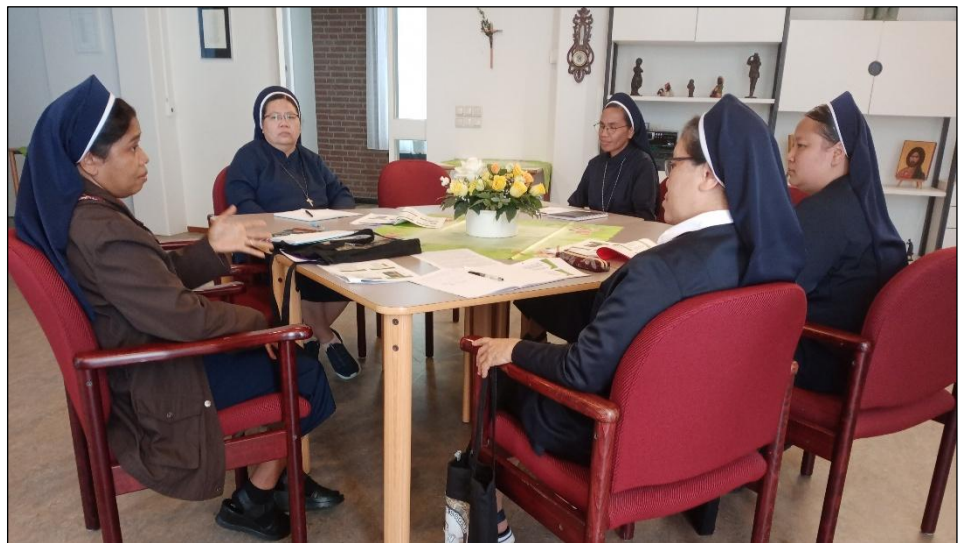
Sharing kelompok saat rekoleksi

Siapa yang akan mengunjungi makamku? Yesus mengingatkan aku bahwa aku harus melakukan segala sesuatu untuk kemuliaan Tuhan selagi aku hidup.