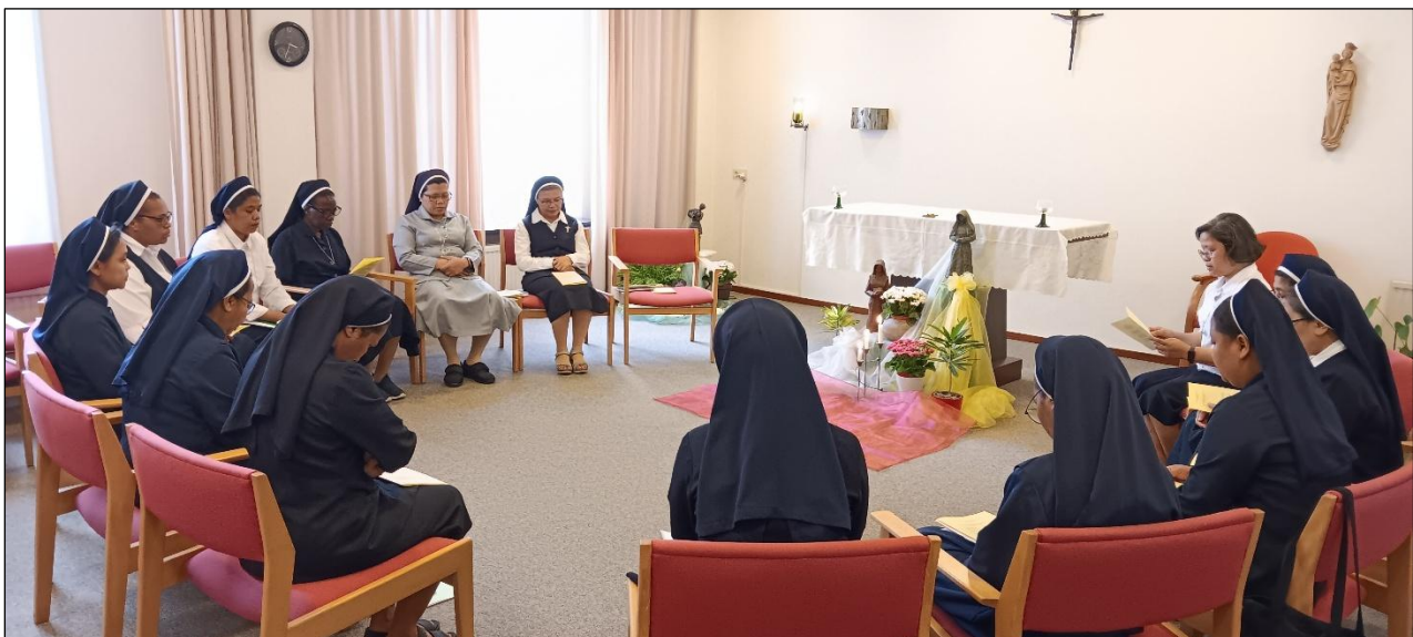
Rekoleksi Penutupan Program Pilgrimasi di Ruang Doa Gedung Servaas, Onder de Bogen

Terima kasih banyak para Suster. Melalui para Suster dan Program Napak Tilas ini, saya sungguh diberkati dengan rahmat dan kasih-Nya. "Terpujilah Allah dalam orang-orang kudus-Nya, dan kuduslah Dia dalam karya-karya-Nya. Amin." (EG 144). (*)