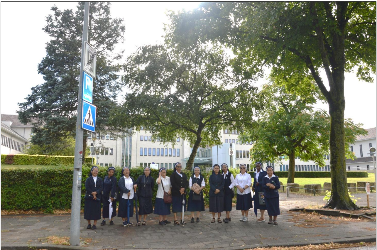
Di depan Gedung Kehakiman Maastricht (dulu adalah RS Annadal yang dikelola oleh Kongregasi)