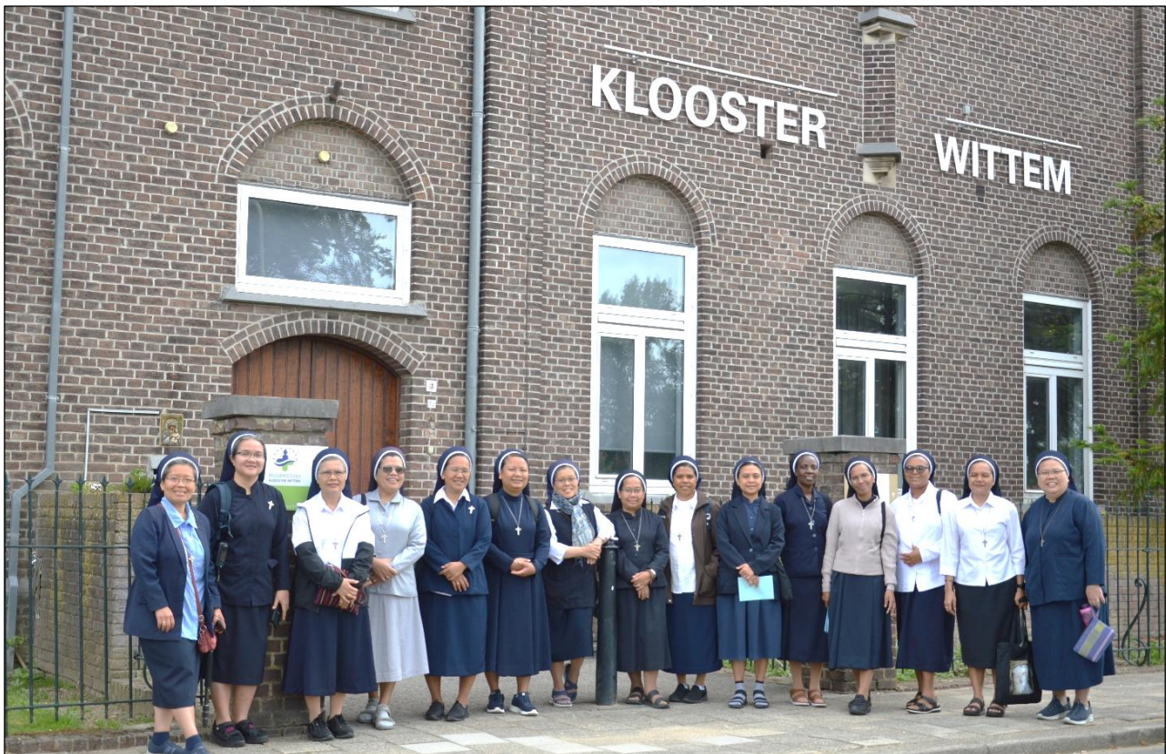
Di depan Biara Redemptoris (CSsR), Wittem