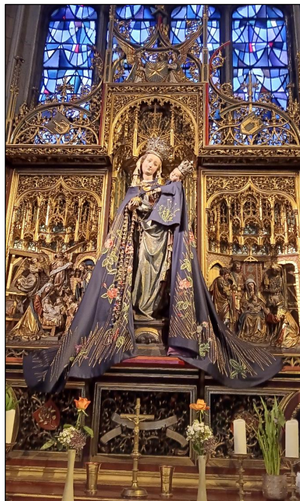
Patung Bunda Maria Bintang Samodra

Saya ingin membagikan pengalaman yang indah mengukir di jiwa saya. Dari Salemba Tengah, Jakarta, kami berangkat tepat pk. 20.00 dengan diiringi doa dan lagu indah Maria Bintang Samodra menyertai perjalanan panjang kami; Dari Indonesia