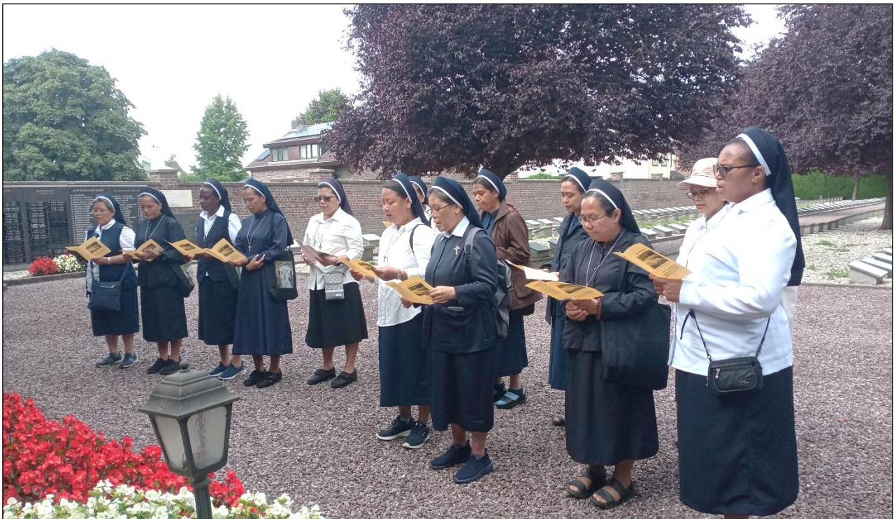
Ziarah ke makam para suster di Rijckholt