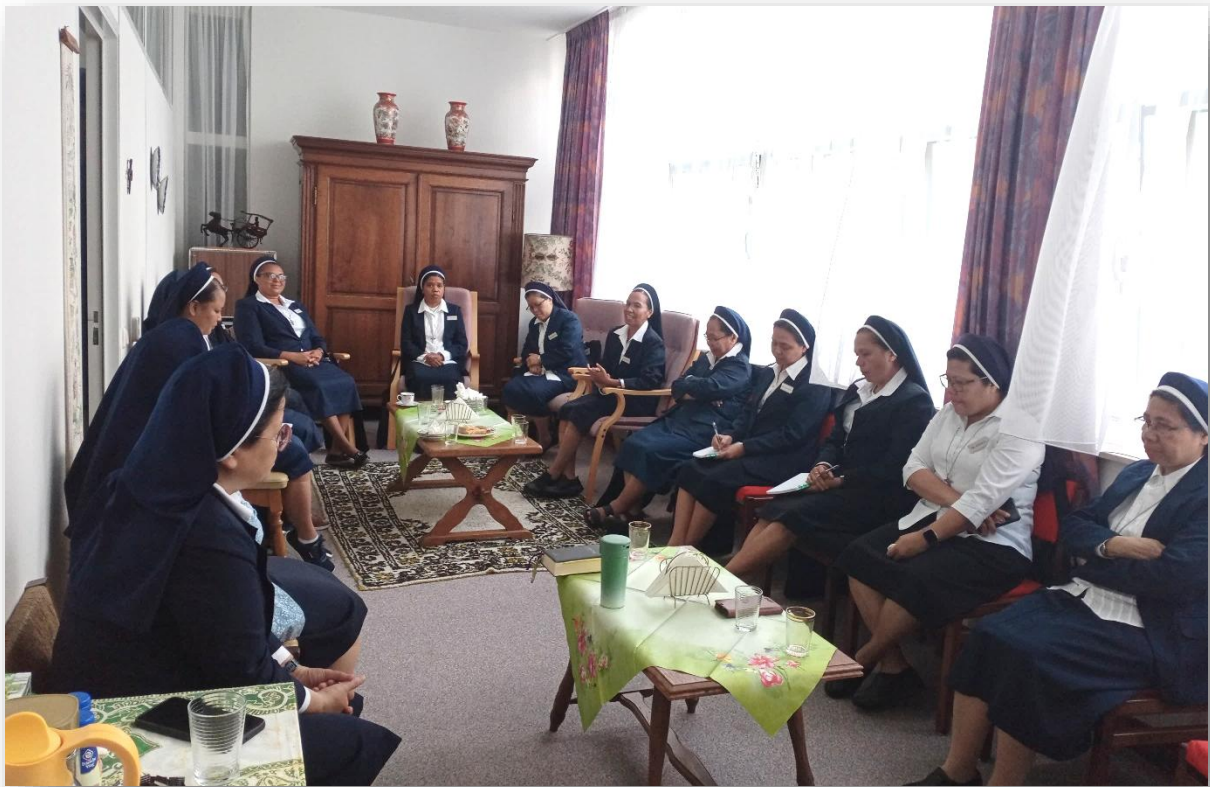
Pertemuan dengan DPU di Ruang Minum DPU