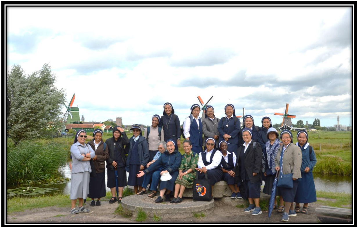
Pengenalan budaya Belanda di Zaanse Schans, Amsterdam