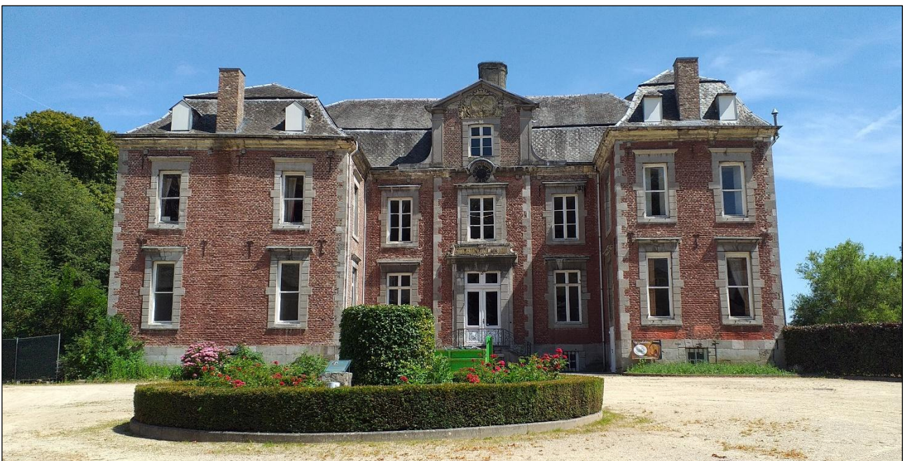
Kastil Vilain XIII di Leut tampak dari depan

Hal yang mengagumkan dan menginspirasi ialah Bunda Elisabeth dapat mengolah pengalaman masa kecilnya ini, sehingga pengalaman ini menjadikan Bunda Elisabeth peka dengan penderitaan orang lain. Melalui pengalaman masa kecilnya yang terolah itu, Bunda Elisabeth selalu mengutamakan keselamatan jiwa-jiwa. Pengalaman masa kecil yang tidak menyenangkan ketika tekun diolah akan menjadi kekuatan, yang tercermin lewat belarasa terhadap mereka yang menderita bahkan mau ambil bagian dalam karya keselamatan Allah yaitu keselamatan jiwa-jiwa.