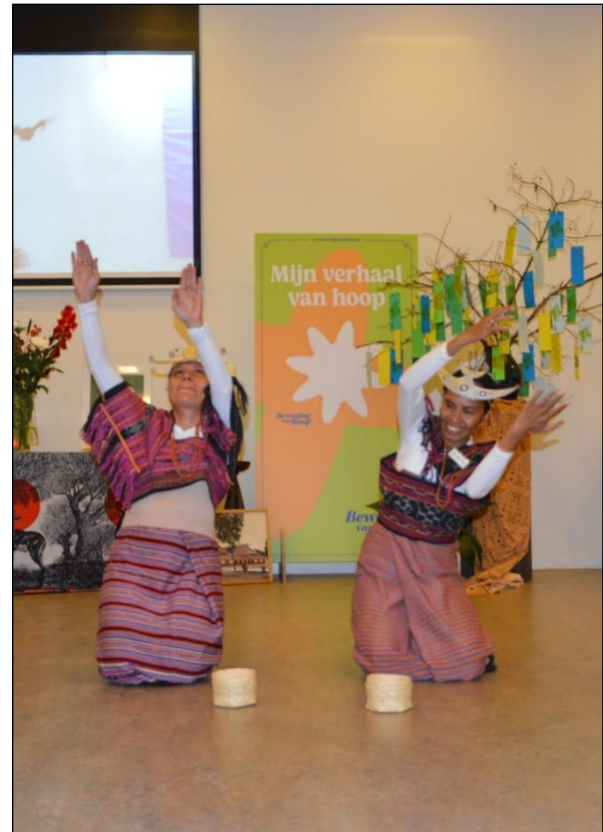
Tarian dari Timor Leste pada acara Pentas Budaya

cerita hidup, dan keterlibatan nyata dalam karya kasih. Dengan demikian, rumah pembinaan menjadi tempat di mana warisan Bunda Elisabeth tidak hanya diceritakan, tetapi diwariskan dan “hidup” di hati kita.