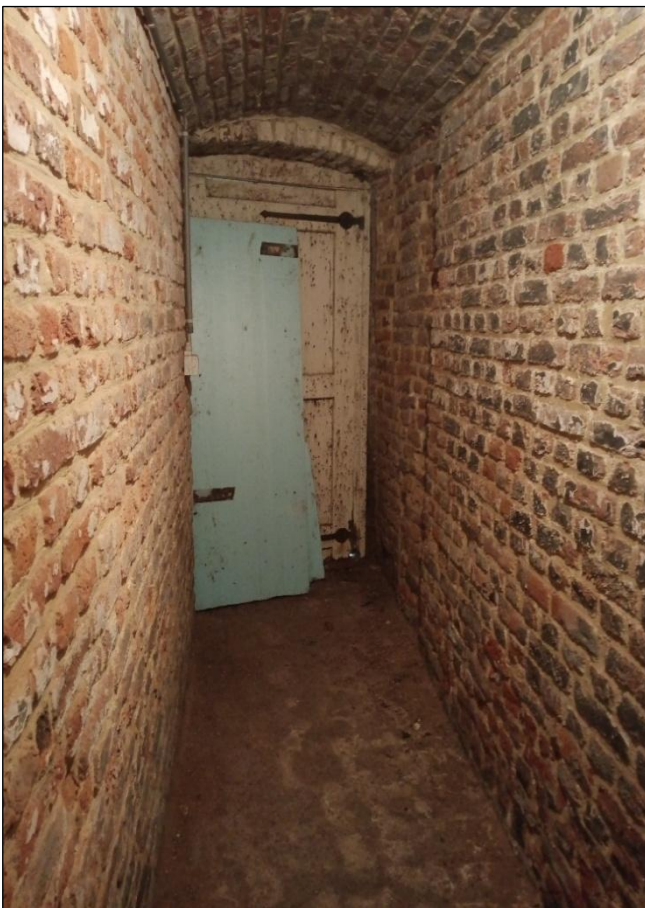
Situasi lorong bawah tanah di Kastil Vilain XIII saat ini