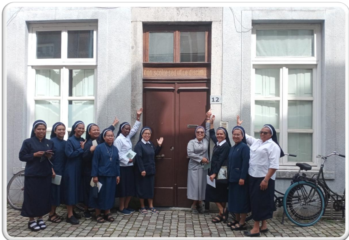
Di depan Biara Pertama di Lenculenstraat, yang saat ini dijadikan apartment mahasiswa