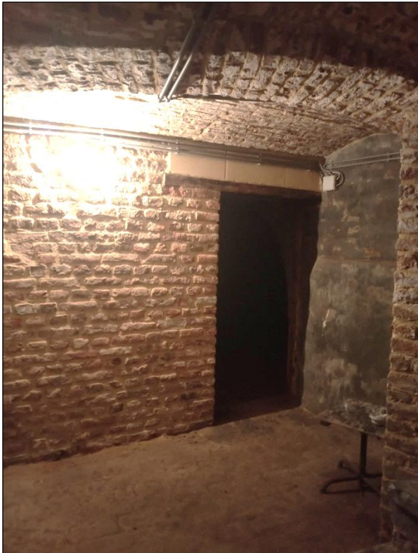
Salah satu ruang bawah tanah di Kastil Vilain XIII, Leut