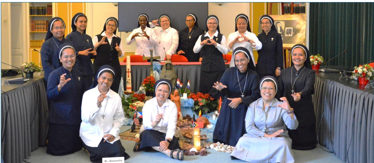
Setelah Penutupan Program di Ruang Kapitel

Program pilgrimasi ini telah mendidikku untuk menghargai setiap peristiwa dan percaya akan rencana Allah juga ketika saya tidak sepenuhnya mengerti akan kehendak-Nya. Sekarang ini saya menyadari bahwa untuk menjadi seperti Bunda Elisabeth, seorang yang hatinya dipenuhi dengan cinta dan tanggung jawab adalah suatu perjalanan yang berkelanjutan. Saya dipanggil untuk menjadi setia, mampu bertahan dalam menghadapi