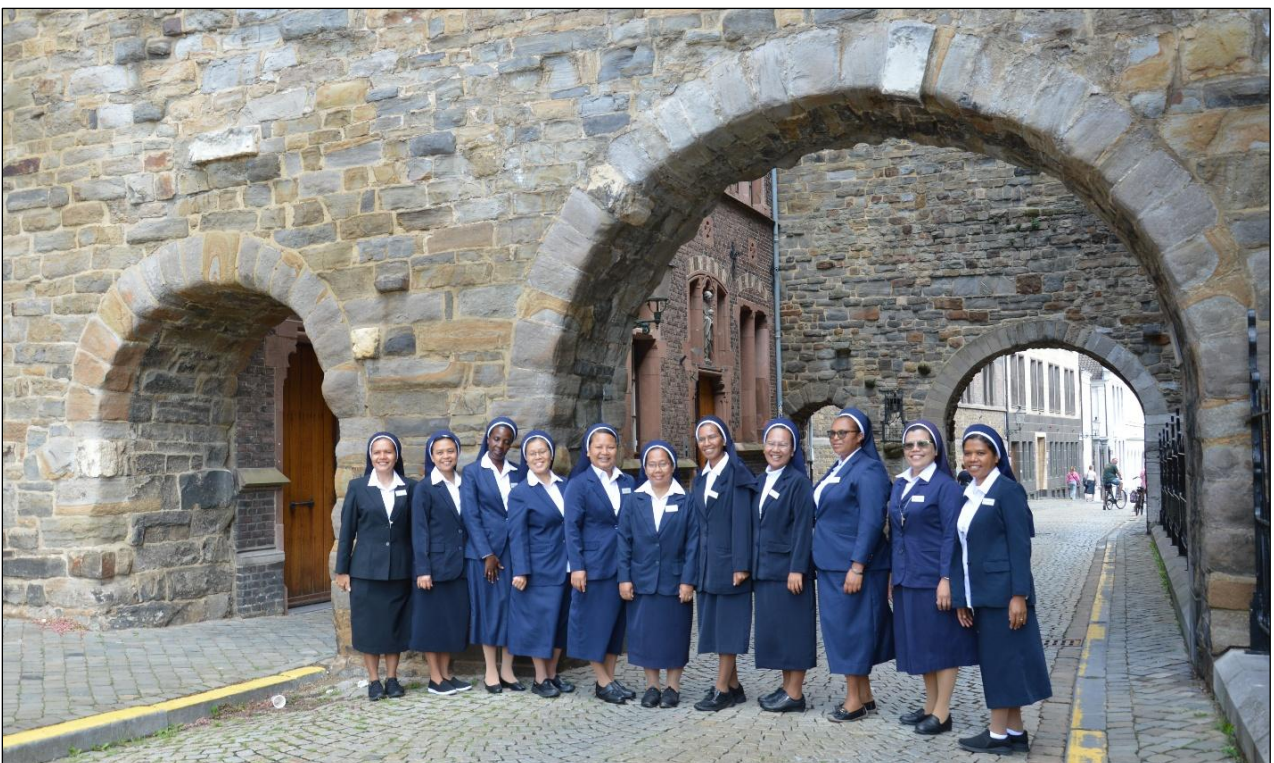
Peserta Pilgrimasi di depan Biara Induk Onder de Bogen (di bawah lengkungan)

Semangat hidupnya sungguh meneguhkan panggilan saya. Pengalaman pribadi saya tentang awal panggilan saya untuk mengabdikan diri kepada Tuhan juga semata-mata karena saya merasa sangat dikasihi oleh Tuhan yang menciptakan saya. Dari sini saya merasa bahwa semua yang saya miliki semata-mata karena Tuhan. Itulah sebabnya saya sungguh percaya bahwa Tuhan memiliki rencana untuk hidup saya. Dan sejak saat itu,