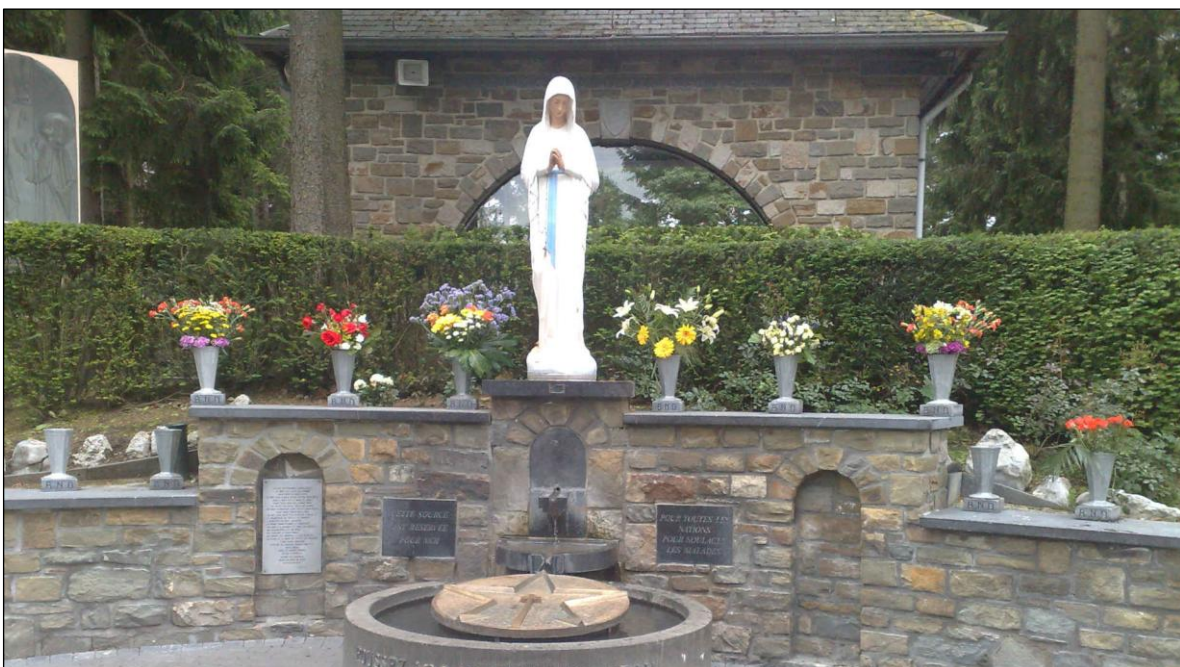
Bunda Maria Banneux, Belgia, salah satu tempat ziarah peserta pilgrimasi