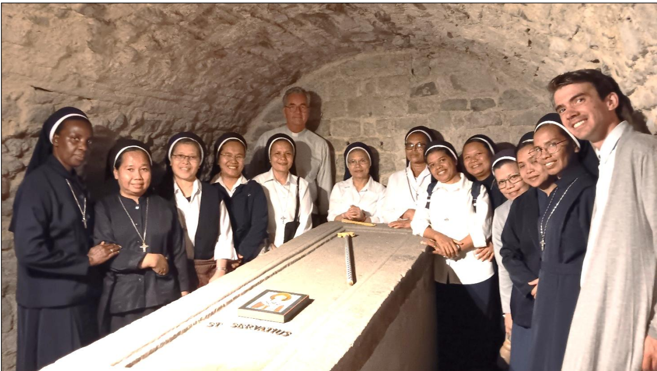
Mengunjungi makam St. Servaas di ruang bawah tanah Basilika St. Servaas, Maastricht