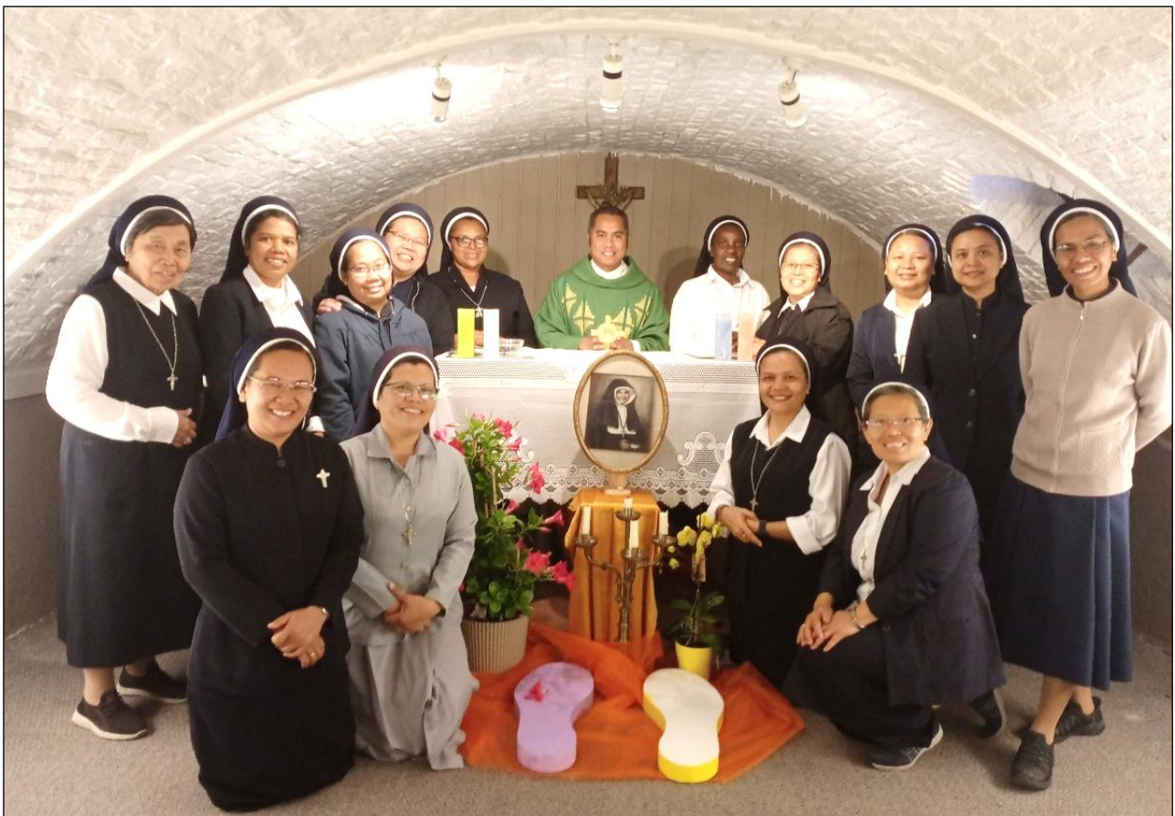
Setelah Misa di kapel bawah tanah Komunitas Leut, Belgia

Program pilgrimasi selama tiga minggu terasa cepat sekali, akan tetapi saya sangat menikmati dengan sukacita dan terasa seperti retret bersama Bunda Elisabeth. Beberapa input dari para Suster dan seorang Pastor