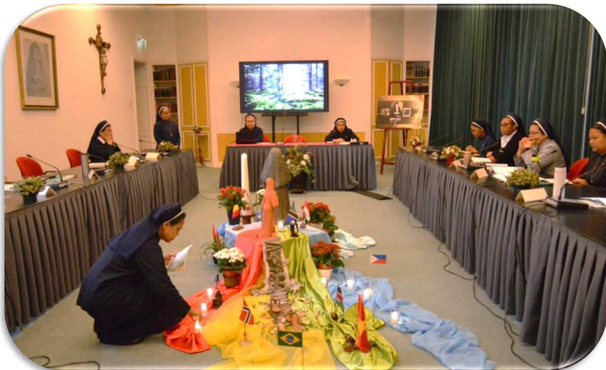
Perwakilan peserta pilgrimasi menyalakan lilin menandai dibukanya Program Pilgrimasi di Ruang Kapitel