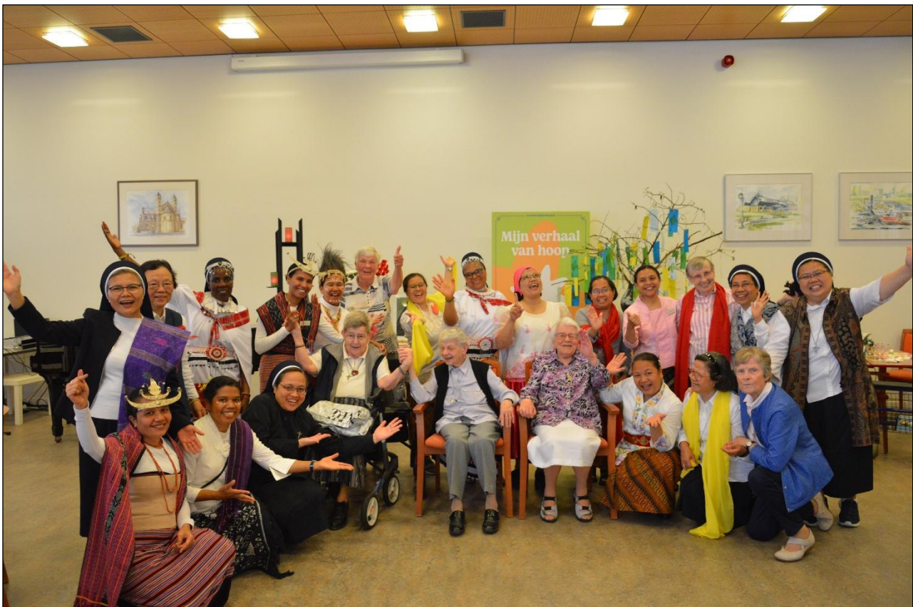
Bersama beberapa Suster Belanda setelah acara Pentas Budaya di Ruang Cecilia, Onder de Bogen