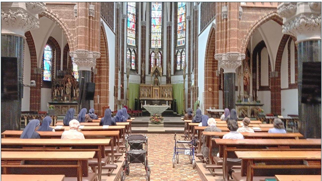
Untuk pertama kalinya peserta pilgrimasi menginjakkan kaki di Kapel Biara Induk Onder de Bogen

kasih, Tuhan, karena Engkau mengizinkan saya datang. Kami berdoa bersama. Rasanya seperti Bunda Elisabeth dan seluruh Surga bersukacita, para malaikatpun bergembira. Tuhan mengizinkan saya untuk mengalami ini semua. Apa yang terjadi sebelum saya pergi adalah bagian dari proses formasi saya; Tuhan menguji iman saya. Dia membersihkan hati saya untuk mengalami kasih-Nya. Di kapel yang indah ini, saya memohon rahmat keterbukaan hati agar dapat menjalani semua proses ziarah ini dengan baik. Saya juga memohon rahmat keterbukaan agar dapat mengalami sentuhan Tuhan dalam setiap pengalaman saya.