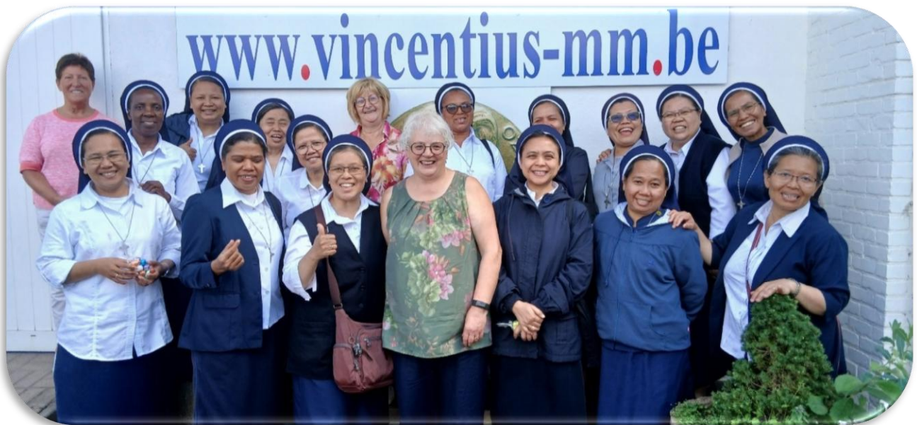
Saat berkunjung ke Yayasan Vincentius, salah satu tempat dimana para suster Komunitas Leut, Belgia, berkarya