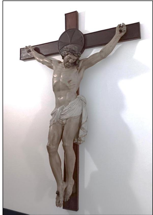
Salib di depan Kapel Onder de Bogen