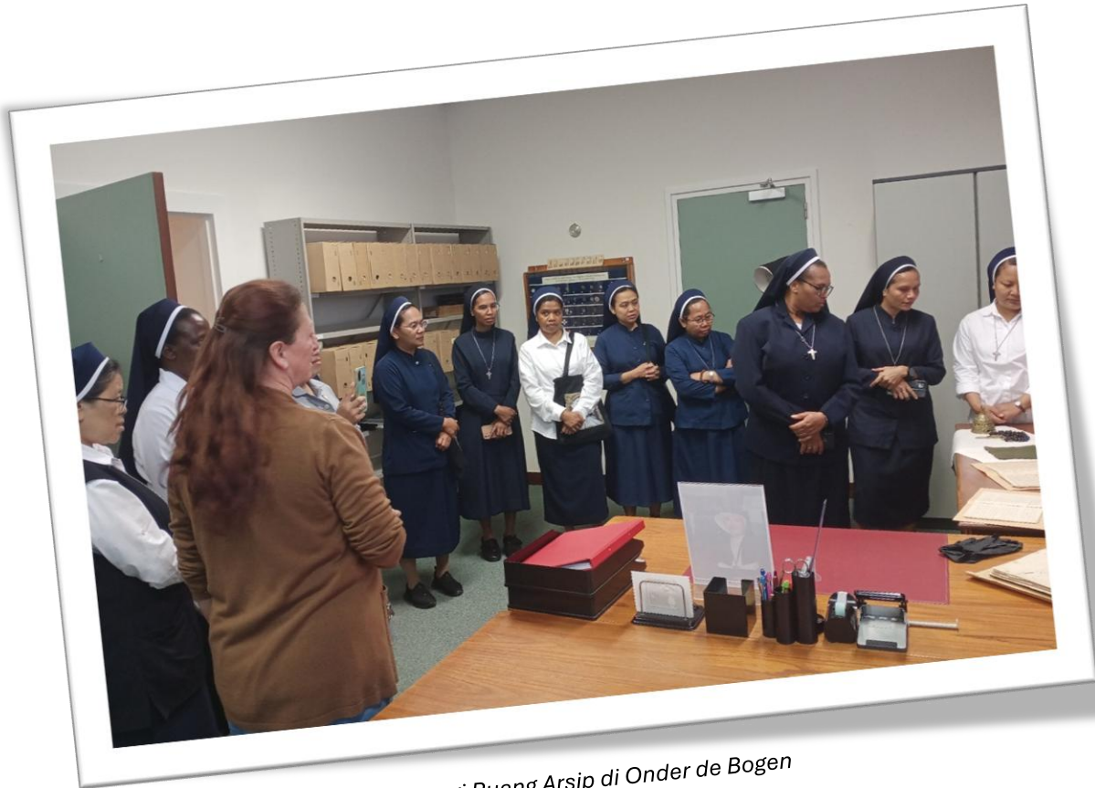
Mengunjungi Ruang Arsip di Onder de Bogen