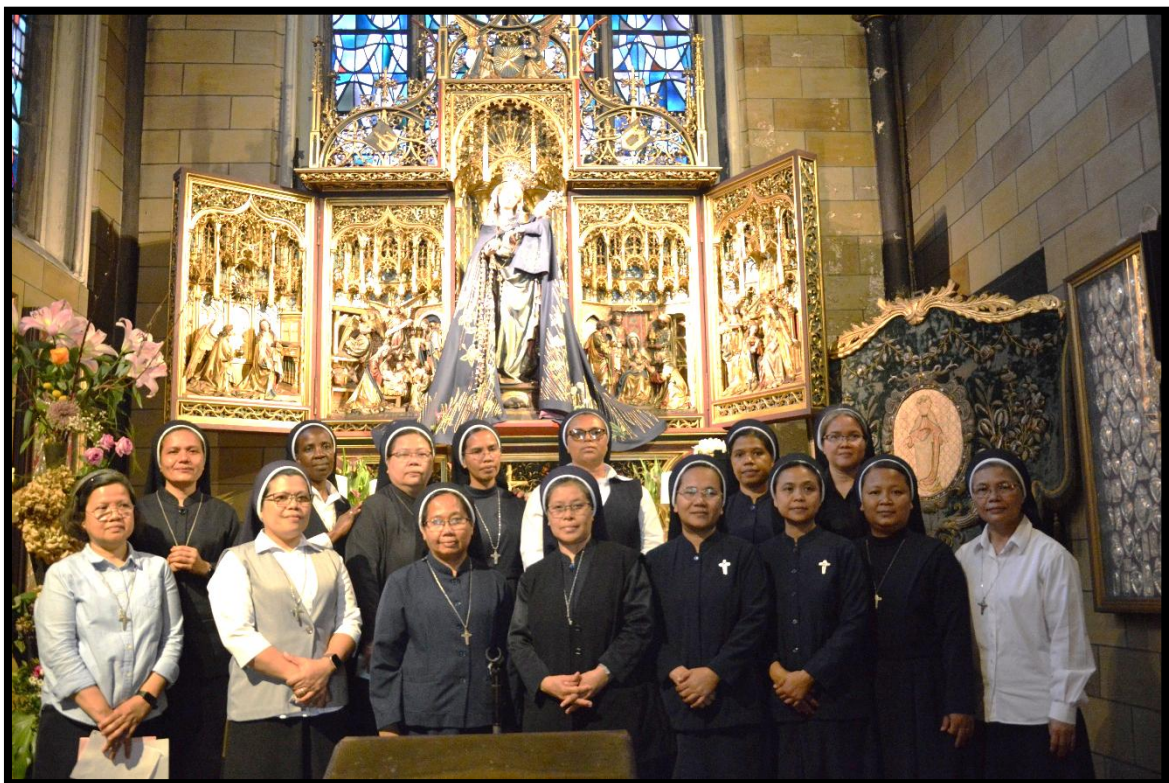
Di depan Patung Maria Bintang Samudera saat berkunjung ke Basilika Bunda Maria Bintang Samudera