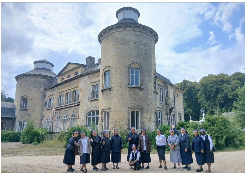
Kastil Vilain XIII di Leut, tampak dari bagian belakang bangunan

tempat harta karun tersembunyi, informasi yang memperkaya dan memberi hidup, serta adanya perjumpaan dan didengarkan oleh dunia. Pengalamannya di Kastil, terutama bersama keluarganya dan bersama ayahnya merupakan tempat pelatihan untuk menghadapi penderitaan dan membentuk nilai-nilai hidup; sebuah wadah peleburan