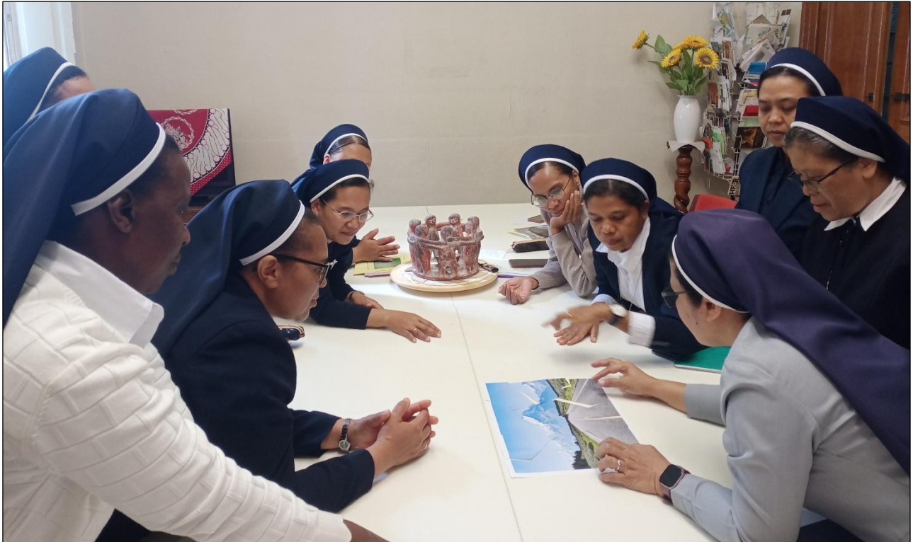
Dinamika kelompok di Komunitas Leut, Belgia

penyertaan Tuhan bagi kami. Doa itu juga menjadi pengingat bahwa kami telah tiba di tempat yang sangat berarti: Rumah Induk Kongregasi kita.