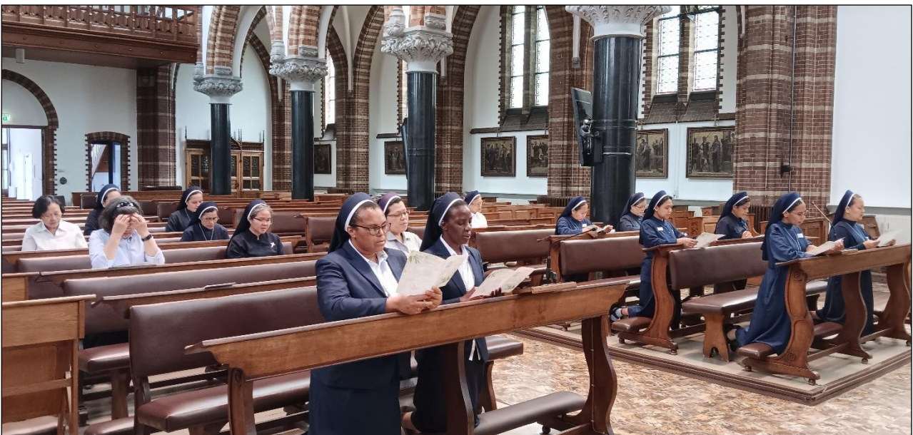
Doa syukur atas keselamatan perjalanan untuk para suster dari Tanzania di Kapel Onder de Bogen, Maastricht