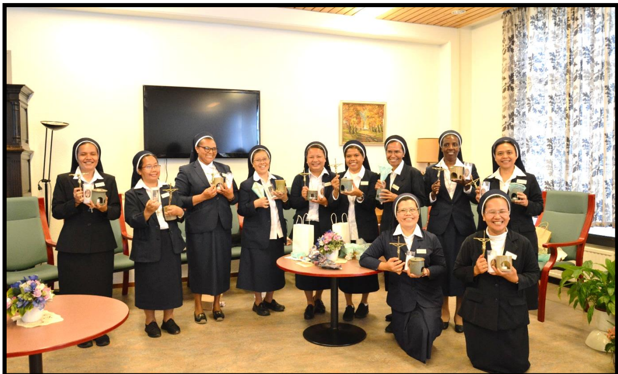
Dengan wajah gembira penuh syukur, para peserta pilgrimasi menerima kenang-kenangan dari Dewan Pimpinan Umum dan Dewan Pimpinan Regio Belanda