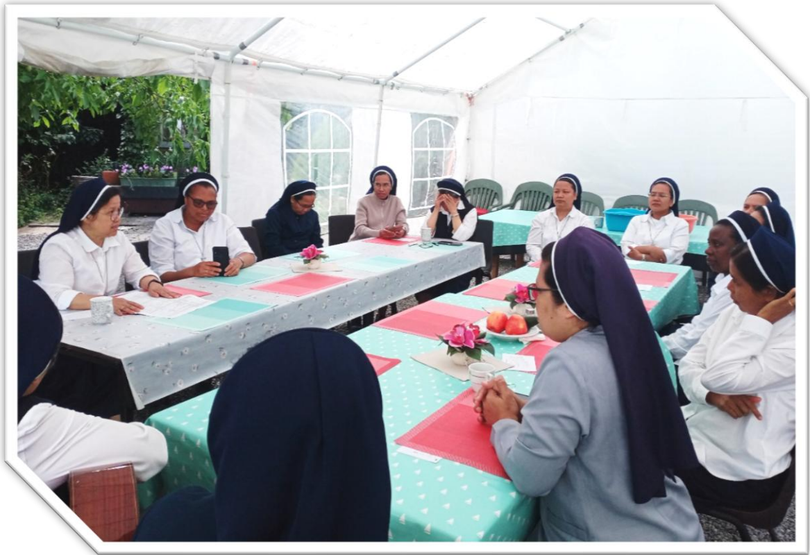
Pertemuan di bawah tenda - halaman belakang Komunitas Leut, Belgia