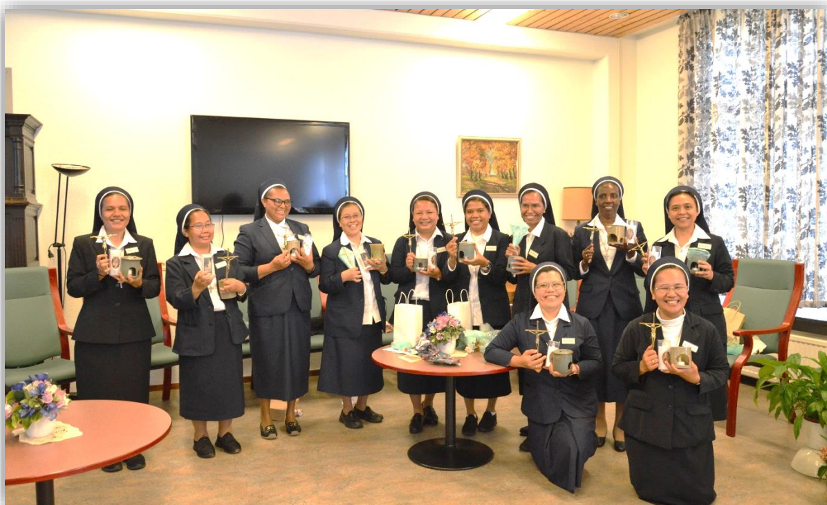
Met vreugde en dankbaarheid in hun hart namen de pelgrims de attenties van het Generaal Bestuur en het Nederlandse Regionaal Bestuur in ontvangst.