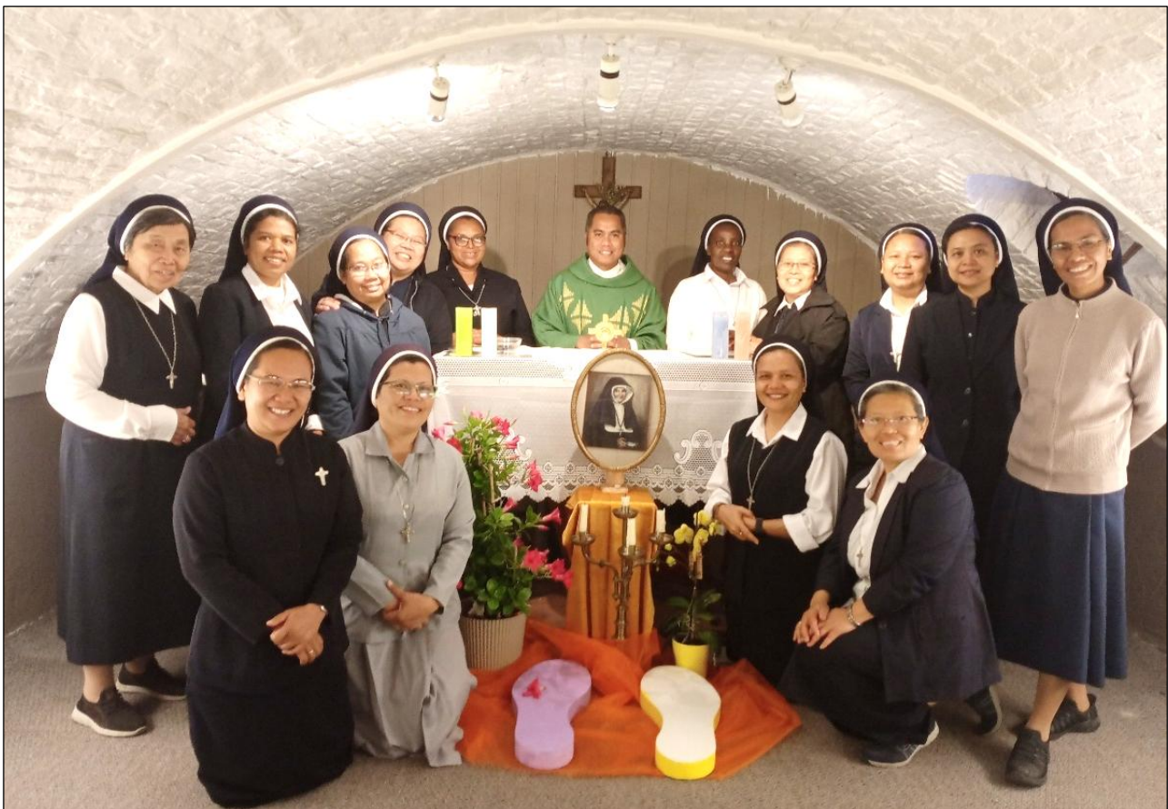
Na de mis in de ondergrondse kapel van de Leut-community in België.