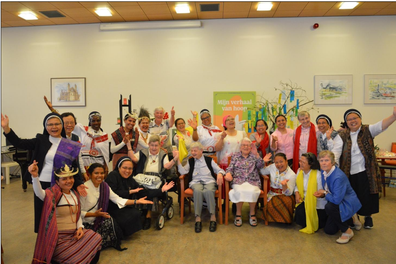
Met een paar Nederlandse zusters na het culturele optreden in de Ceciliazaal, Onder de Bogen.

Moge Zijn Naam voor altijd verheerlijkt worden. Amen. (*)