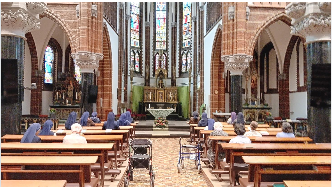
Voor het eerst betraden de pelgrims de Kapel in het Moederhuis Onder de Bogen.