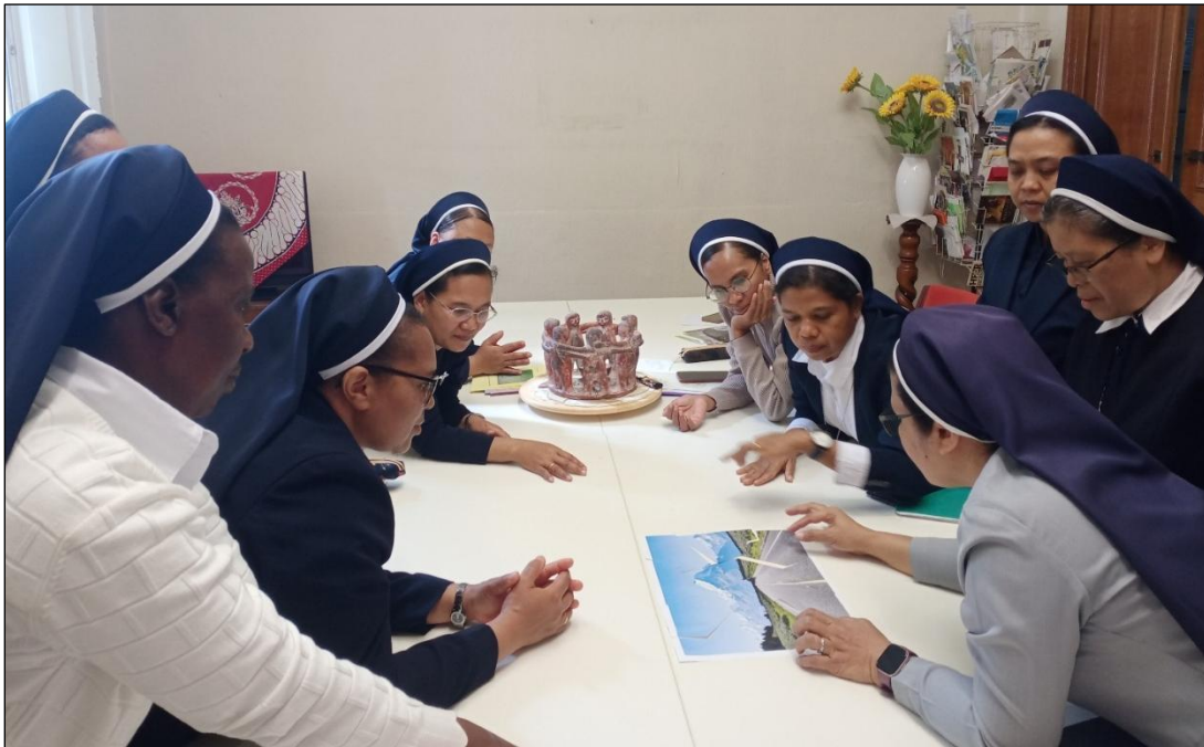
Groepsdynamiek binnen de Leut-community in België.