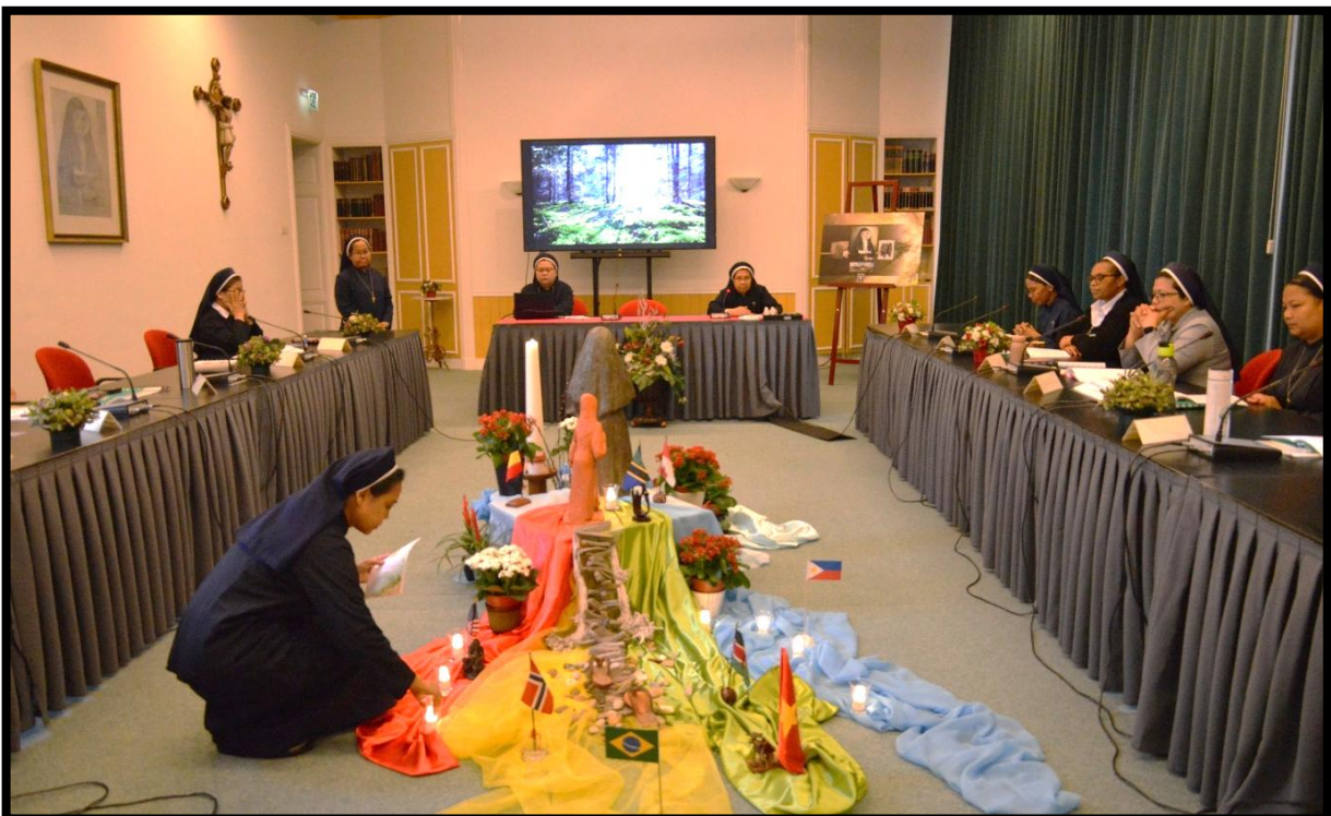
Een vertegenwoordiger van de pelgrims steekt een kaars aan ter gelegenheid van de opening van het Pelgrimageprogramma in de Kapittelzaal.