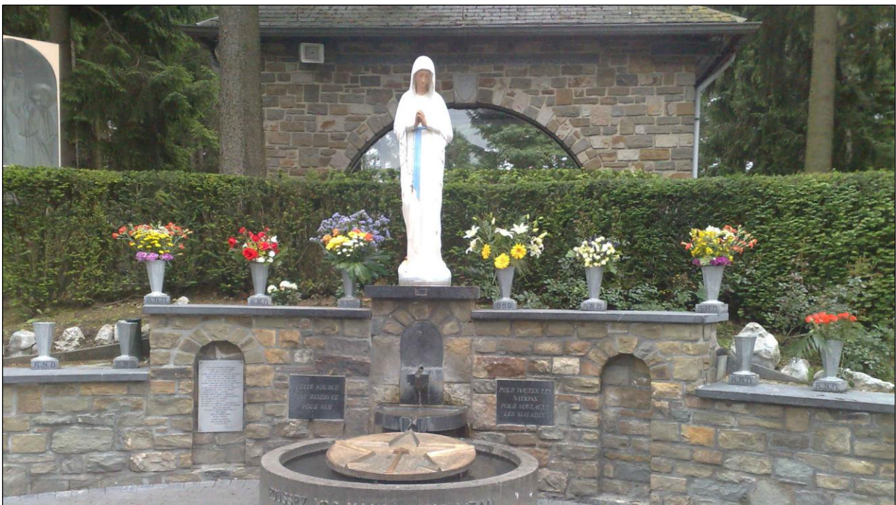
Onze-Lieve-Vrouw van Banneux, België, een van de bedevaartsoorden.