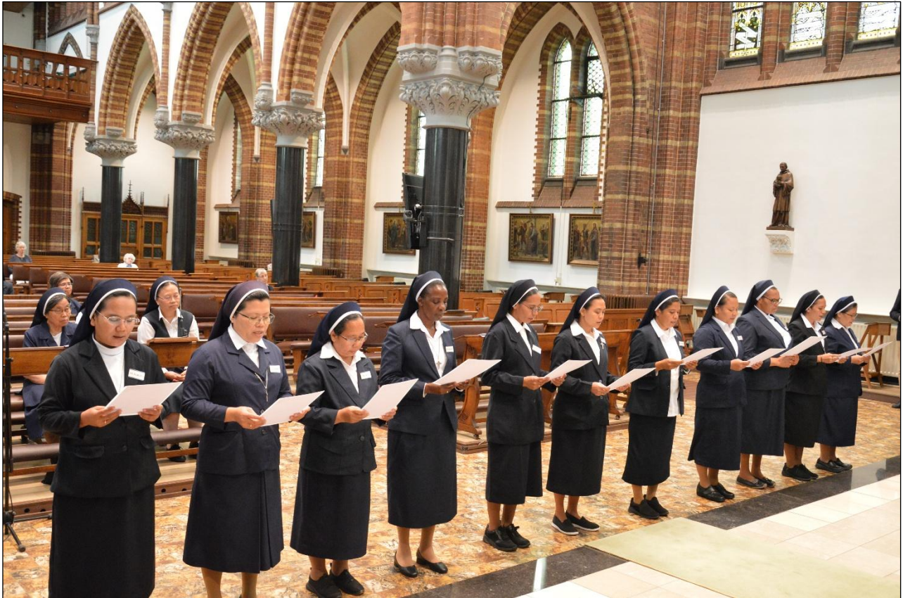
Vernieuwing van de geloften in de kapel Onder de Bogen, Maastricht.