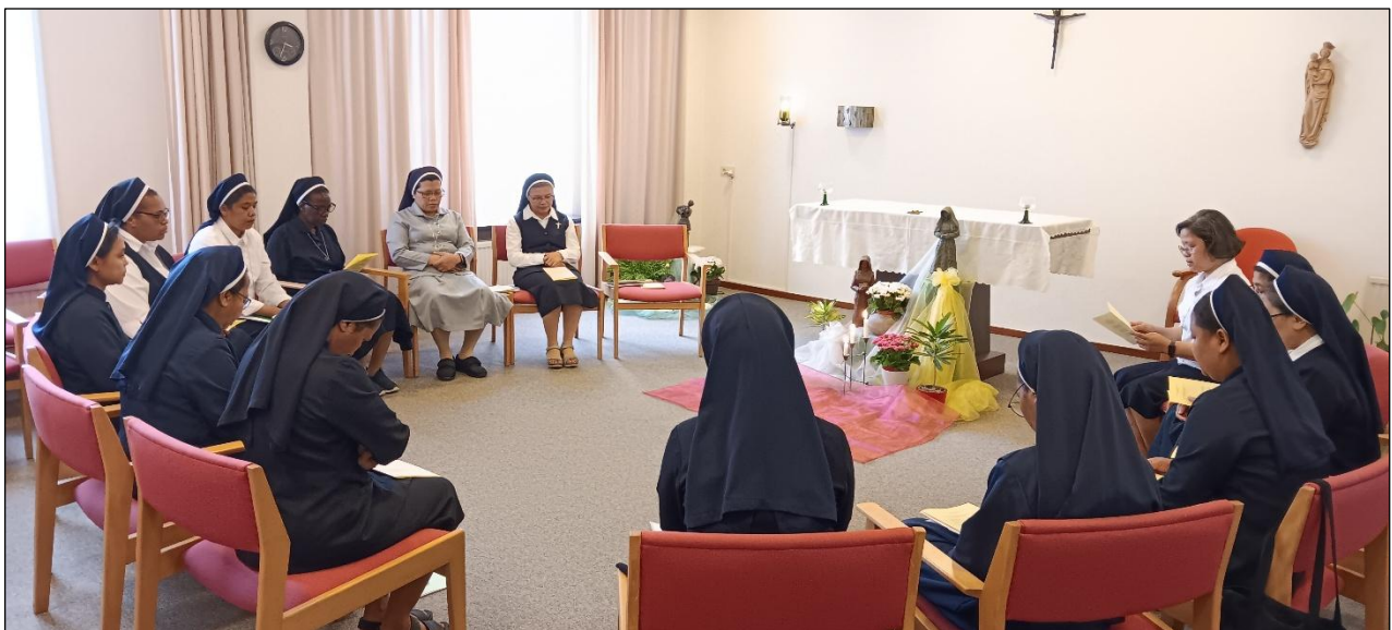
Afsluiting van de Beziingsdag in de gebedsruimte van het Servaasgebouw, Onder de Bogen.