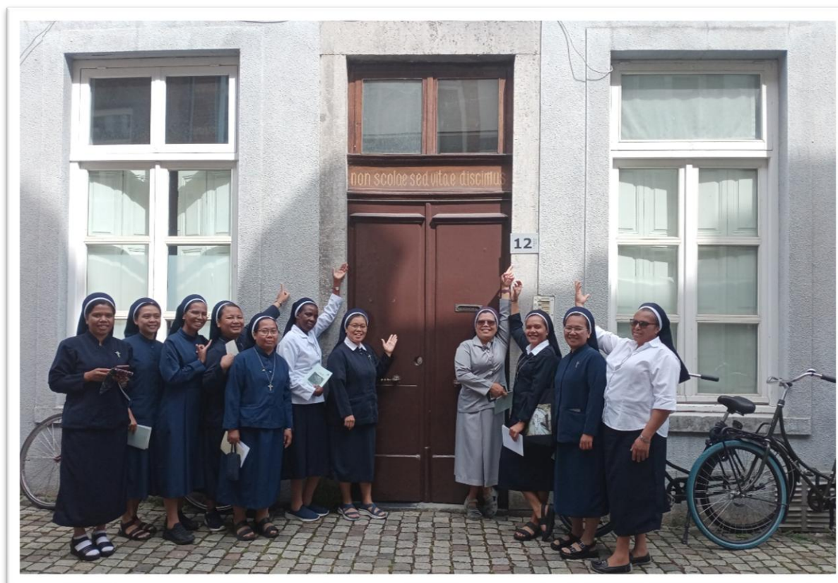
Tegenover het Eerste Klooster aan de Lenculenstraat, dat momenteel in gebruik is als studentenappartement.