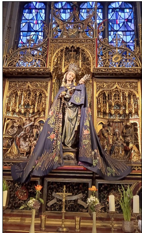
Standbeeld van Onze Lieve Vrouw Sterre der Zee.

Ik wil een prachtige ervaring delen die diep in mijn ziel gegrift staat. Vanuit Salemba Tengah, Jakarta, vertrokken we stipt om 20:00 uur, begeleid door gebeden en het prachtige lied van Maria, Sterre der Zee, tijdens onze lange reis: van Indonesië via Doha naar Maastricht. Liefde en saamhorigheid gaven ons kracht gedurende de hele reis. Toen we in Amsterdam landden, keek ik uit het raam en zag dat het regende. In mijn hart bad ik: "Dank u, God, voor alles. U hebt ons op deze reis begeleid. Dank u ook, Maria, Sterre der Zee, die ons de weg heeft gewezen." Tranen van dankbaarheid vloeiden. Ik fluisterde tegen mezelf: "God heeft een groot wonder verricht." Om precies 13:55 uur landde het vliegtuig op Schiphol. Mijn hart was vervuld van dankbaarheid.