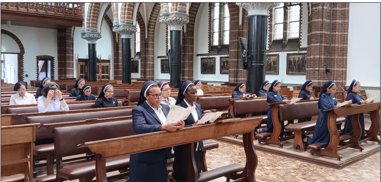
Dankgebed voor een veilige reis van de zusters uit Tanzania in de kapel Onder de Bogen in Maastricht.