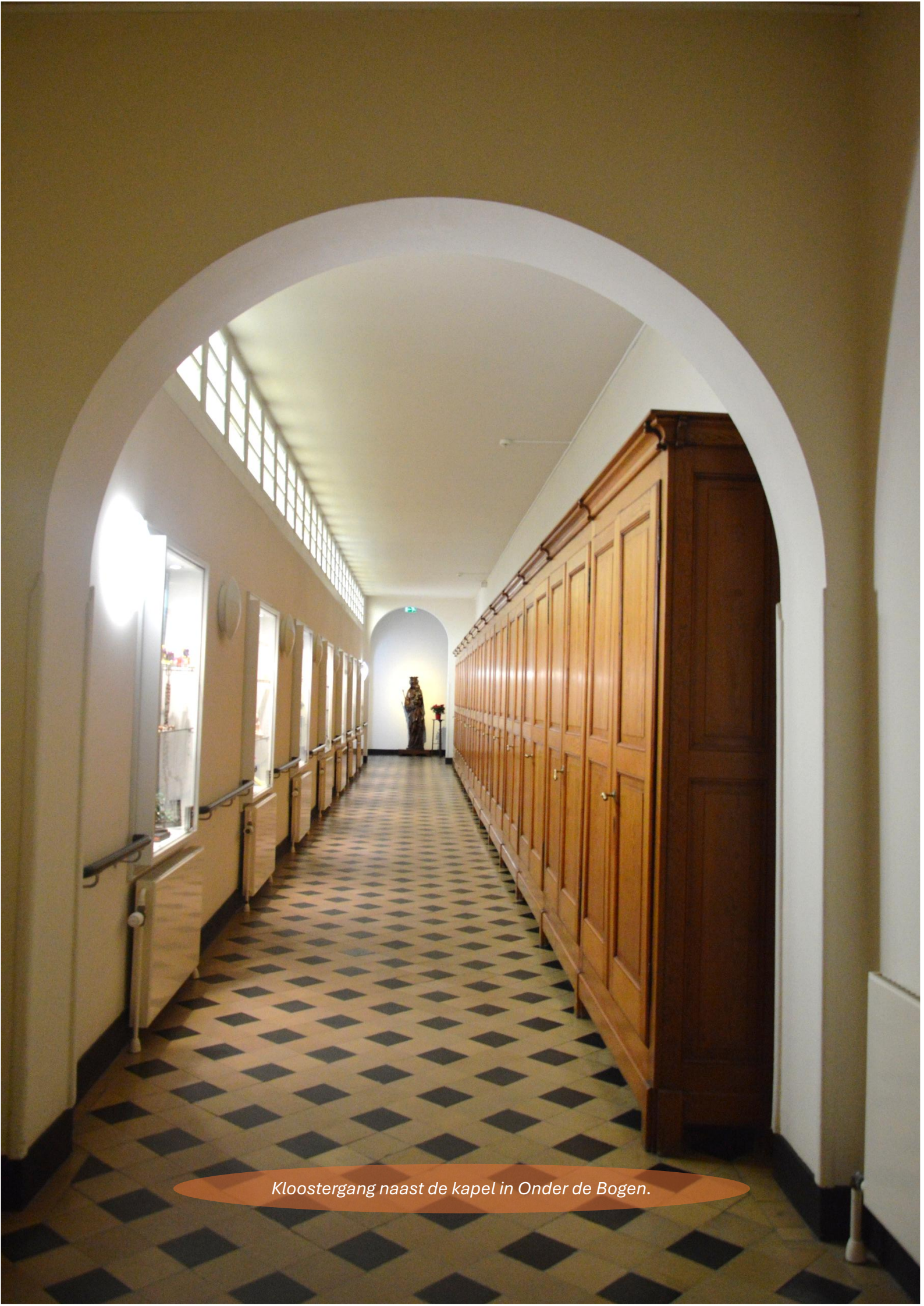
Kloostergang naast de kapel in Onder de Bogen.