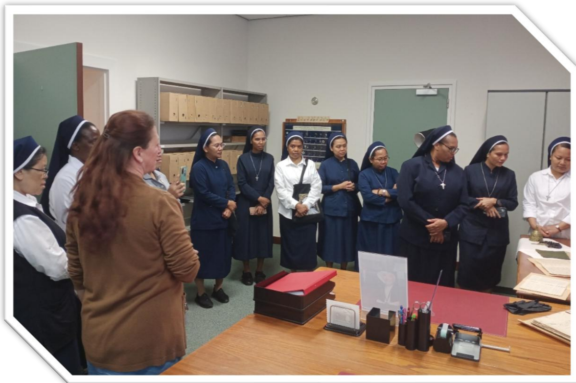
Een bezoek aan het Congregatiearchief, Onder de Bogen.