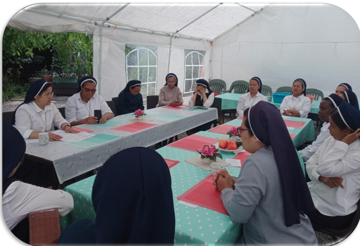
Bijeenkomst in een tent in de achtertuin van de Leut-communiteit in België.