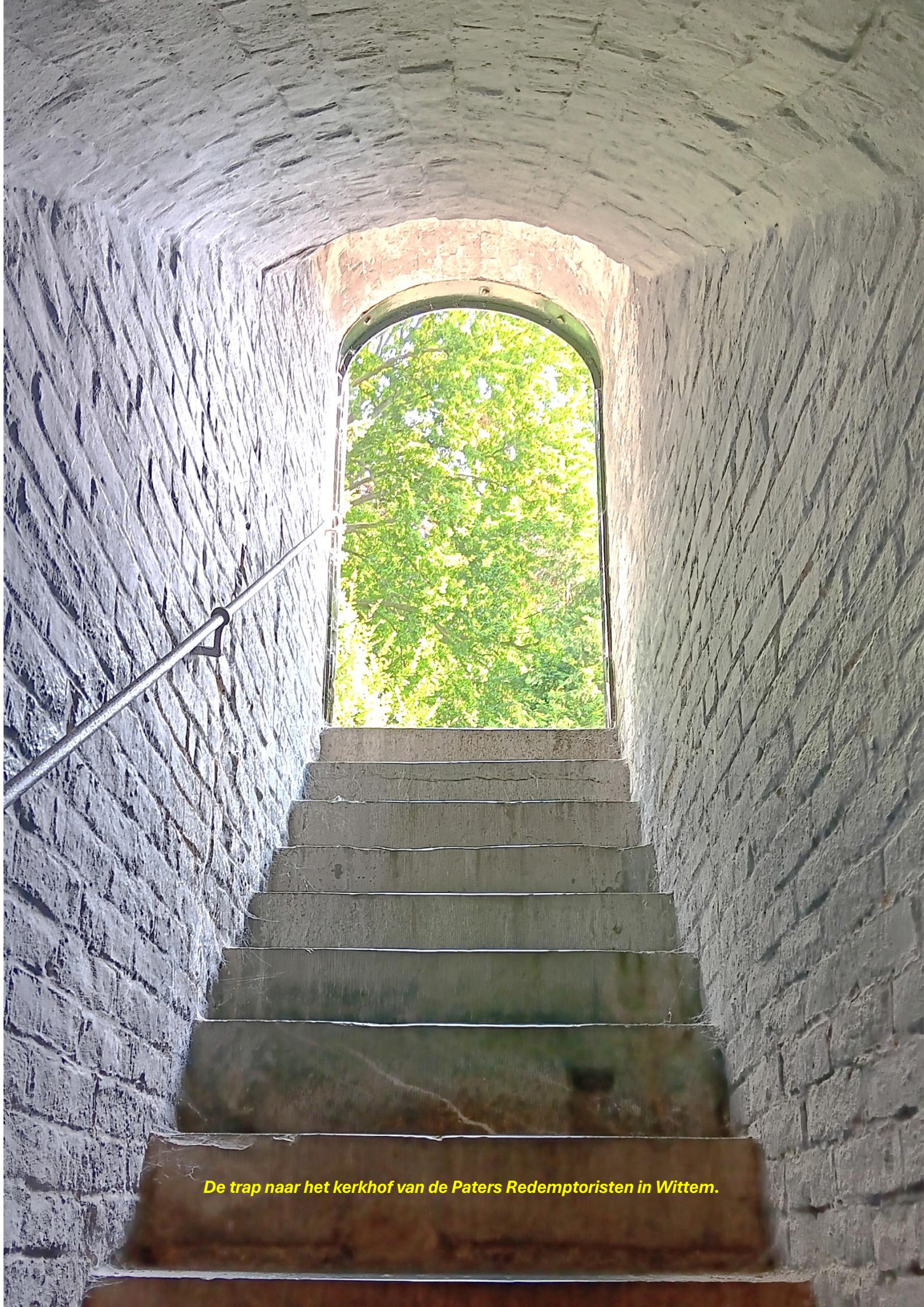
De trap naar het kerkhof van de Paters Redemptoristen in Wittem.