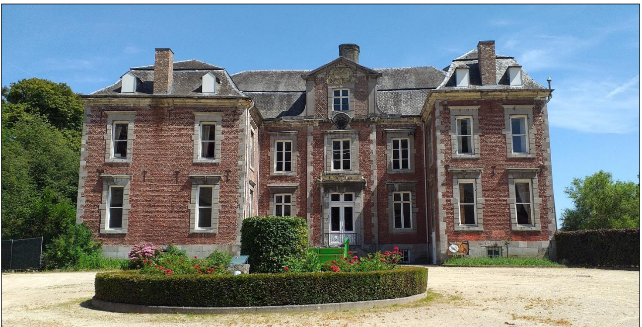
Kasteel Vilain XIII te Leut, gezien vanaf de voorkant.