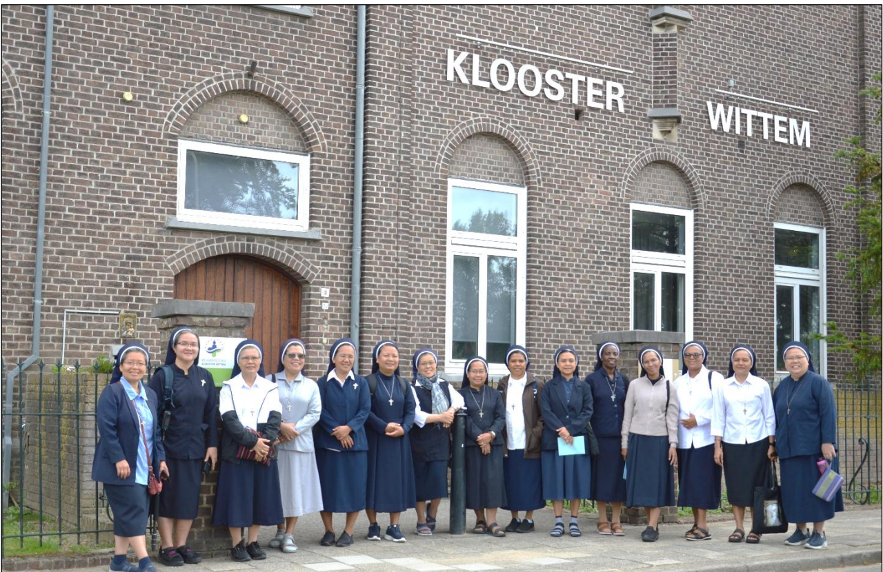
Tegenover het Redemptoristenklooster in Wittem.