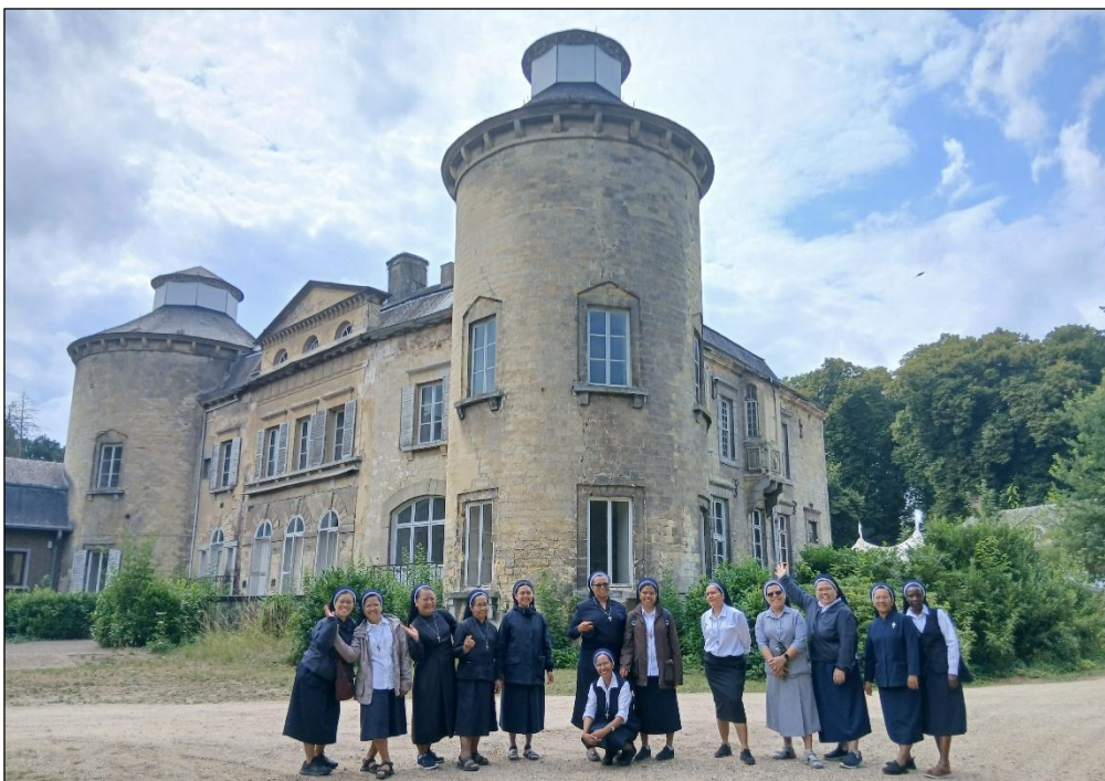
Kasteel Vilain XIII te Leut, gezien vanaf de achterzijde van het gebouw.