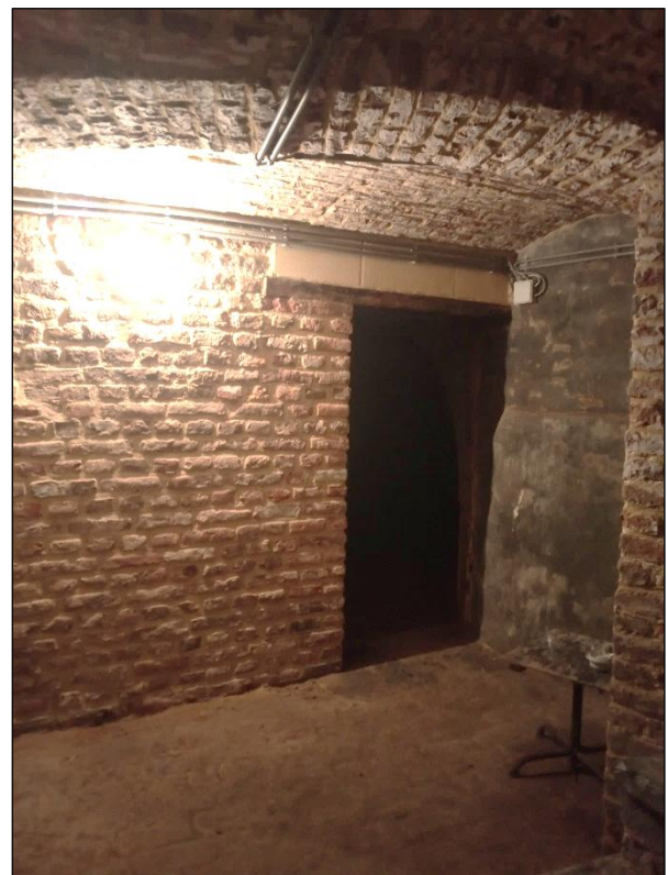
Een van de kelders van kasteel Vilain XIII in Leut.