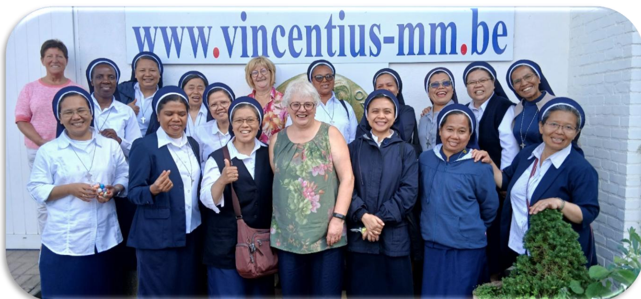
Tijdens een bezoek aan de Vincentiusstichting, één van de plaatsen waar de zusters van de Leut-communiteit in België hun werk verrichten.