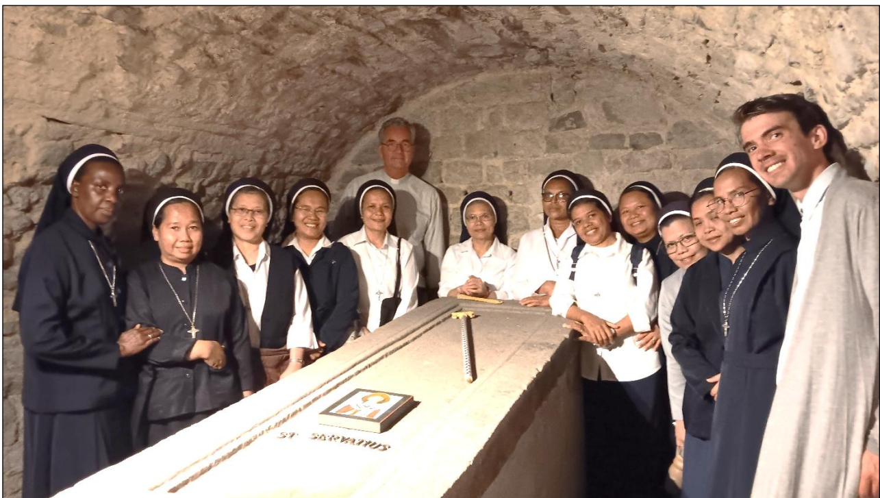
Een bezoek aan het graf van Sint Servaas in de ondergrondse gangen van de Sint Servaasbasiliek in Maastricht.