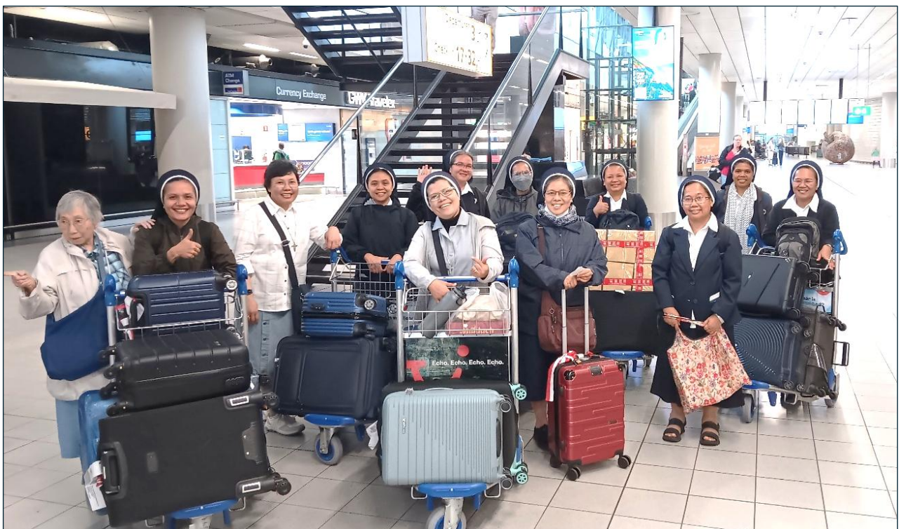
De deelnemers uit Indonesië, Oost-Timor en de Filippijnen zijn veilig op Schiphol in Amsterdam aangekomen.

Tijdens het jubileumjaar voel ik me werkelijk gezegend dat ik samen met Moeder Elisabeth een pelgrimage heb mogen maken van haar geboorteplaats naar haar laatste rustplaats in Leut en Maastricht. Onderweg ben ik talloze inspiratiebronnen, waarden en geloofservaringen tegengekomen die mij diep in het hart hebben geraakt. Ik voelde echt de zachte hand van de onzichtbare God die elke stap begeleidde, ervoor