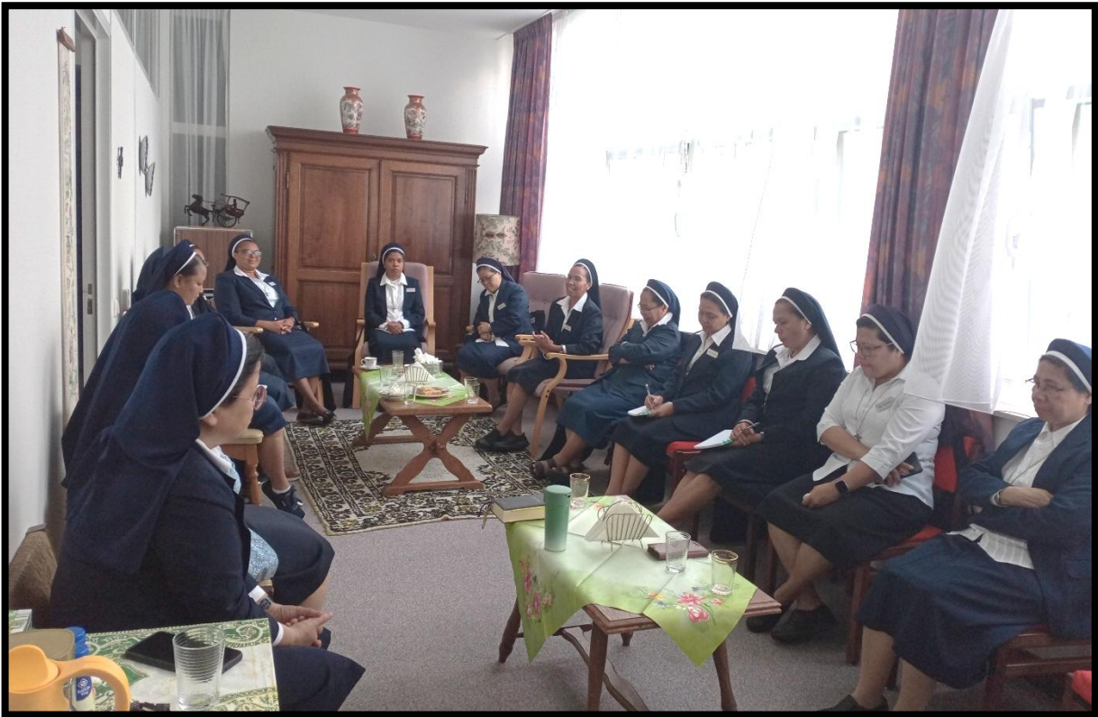
Bijeenkomst met het Generaal Bestuur in de koffiekamer.