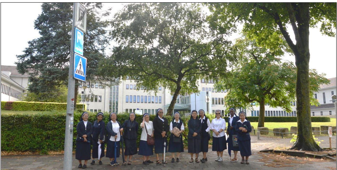
Vóór het gerechtsgebouw van Maastricht (voorheen Ziekenhuis St. Annadal, dat door de Congregatie werd beheerd).

Dit waren mijn ervaringen en vanuit mijn hart wil ik alle zusters van Onder de Bogen en de Provincie Indonesië hartelijk bedanken voor jullie gebeden, aandacht, steun en de diensten die jullie ons tijdens de bedevaart hebben verleend. Jullie aanwezigheid heeft me Gods onvoorwaardelijke liefde in mijn leven doen voelen. Nogmaals hartelijk dank voor alles. God zegene ons! (*)