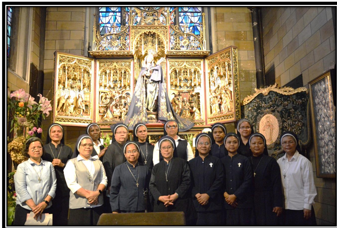
Voor het beeld van Onze Lieve Vrouw Stere der Zee tijdens een bezoek aan de basiliek van OLV Stere der Zee.