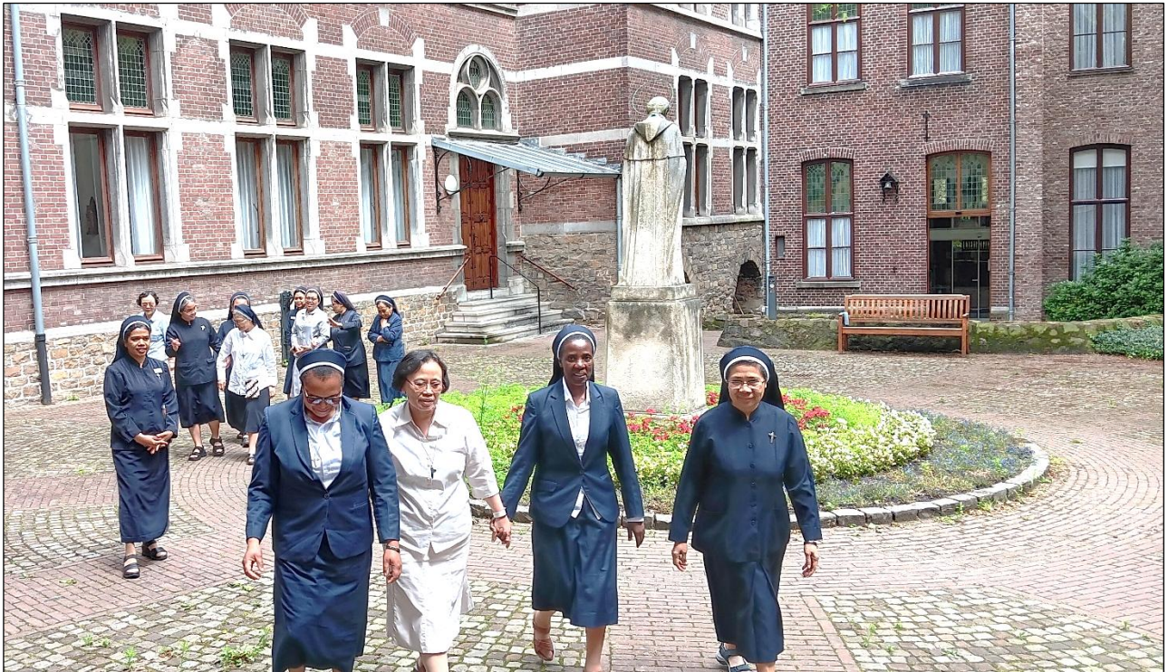
De eerste aankomst van de zusters uit Tanzania in het Moederhuis werd met grote vreugde begroet.