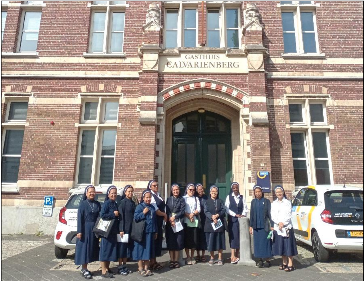
Vóór een van de gebouwen aan de Calvarienberg, waar onze zusters vroeger hebben

om je voor te stellen hoeveel zusters er destijds aanwezig waren en hoe deze plaatsen vandaag de dag blijven bestaan als dierbare herinneringen aan hun toewijding en dienstbaarheid.