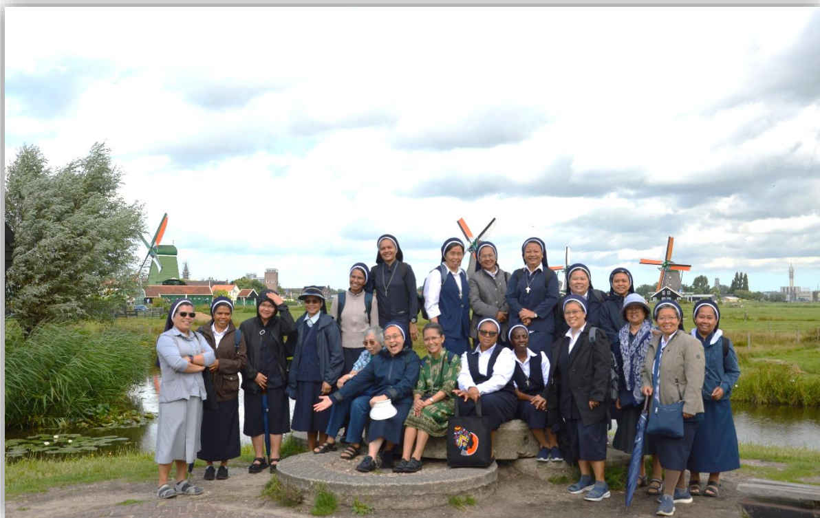
Een kennismaking met de Nederlandse cultuur op de Zaanse Schans, Amsterdam.