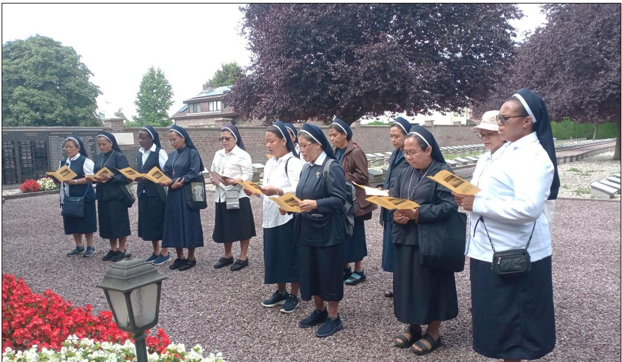
Pelgrimage naar de graven van de zusters op het kloosterkerkhof in Rijckholt.

Ik ben God dankbaar voor de roeping om een CB-zuster te zijn. We hadden een stichteres wier verhaal vastgelegd is in haar eigen handgeschreven boek, *Stichteres van een Congregatie*, en wier levensweg we blijven volgen tijdens onze pelgrimage. Hoewel zij en haar opvolgster niet meer onder ons zijn en begraven liggen in Rijckholt, hebben ze een onschatbare erfenis achtergelaten die nooit verloren zal gaan.