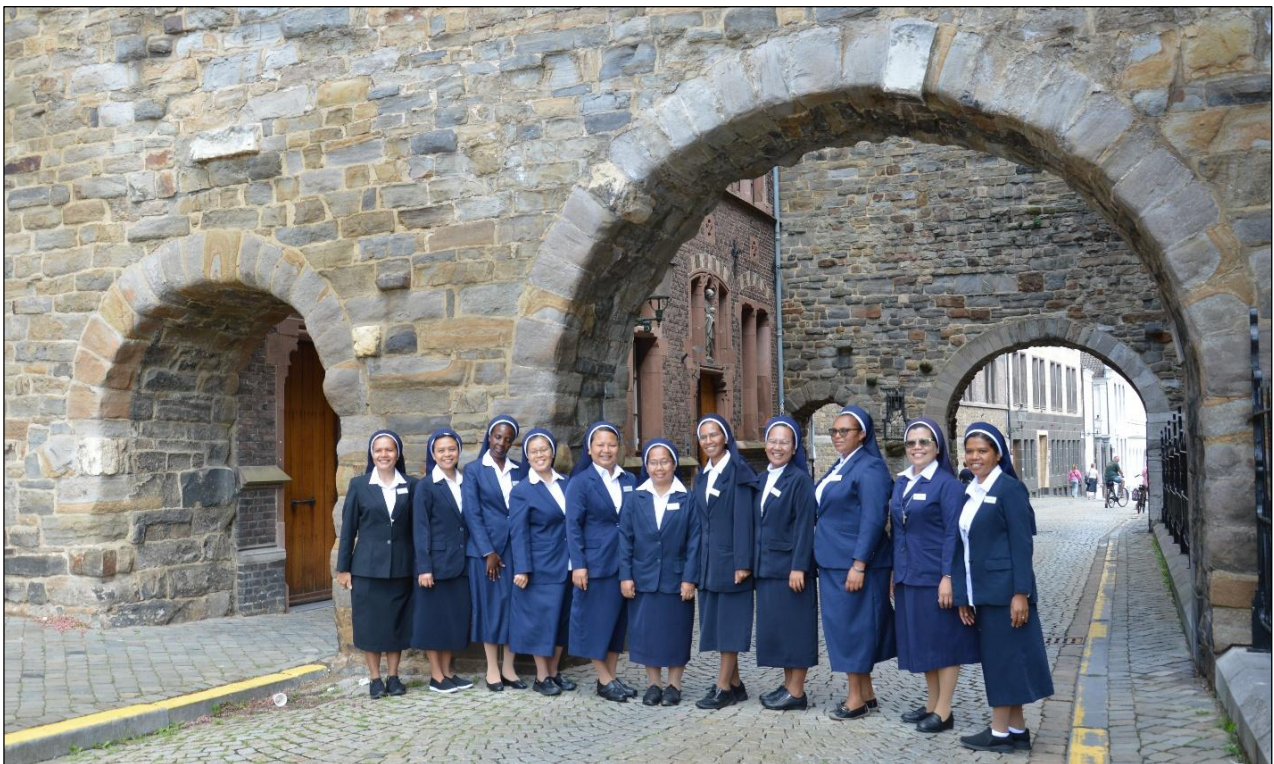
Pelgrims vóór het Moederhuis, Onder de Bogen.

leeft. Haar leven en getuigenis raakten mij diep en bevestigden opnieuw de gave van mijn eigen roeping. Ik herinnerde me dat het begin van mijn roeping om mij aan God te wijden, geworteld was in één eenvoudige waarheid: ik voelde me diep geliefd door de God die mij geschapen heeft. Het is diezelfde liefde die mij tot op de dag van vandaag blijft ondersteunen.