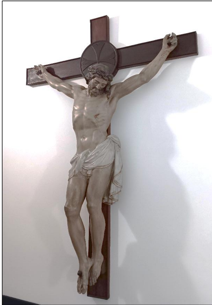
Het kruis voor de kapel 'Onder de Bogen'.